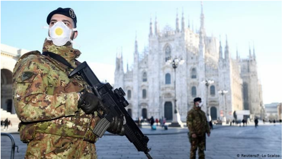
Foto: Milán, Italia.

El sábado 21/3 conversamos con un argentino residente en Milán, quien nos da de primera mano cómo se vive la pandemia, y cómo afecta