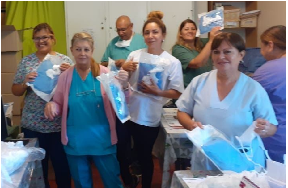
Foto: Hospital Ramos Mejía, CABA