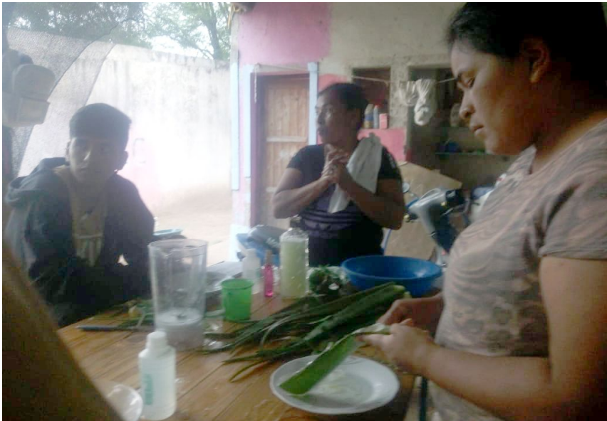
Foto: La CCC de Gral. Mosconi, Salta, prepara alcohol en gel.

La CCC de General Mosconi preparó alcohol en gel para repartir en los merenderos, así como implementó medidas de higiene con soluciones jabonosas para todos los niños y adultos que van a retirar la vianda. Además, colectaron ropa que fue seleccionada y enviada a la misión donde funciona uno de nuestros merenderos.