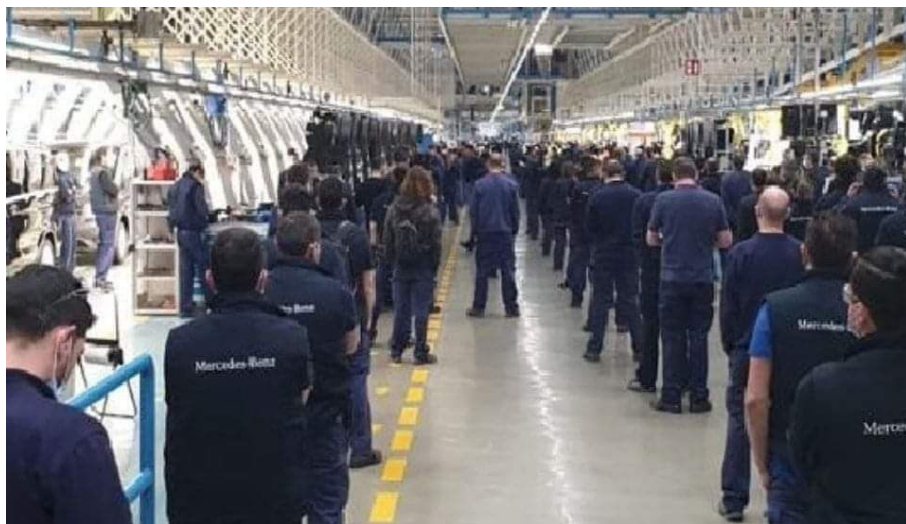
Foto: Trabajadores de la Mercedes Benz del País Vasco.

La Organización Internacional del Trabajo (OIT) estimó que el desempleo mundial podría