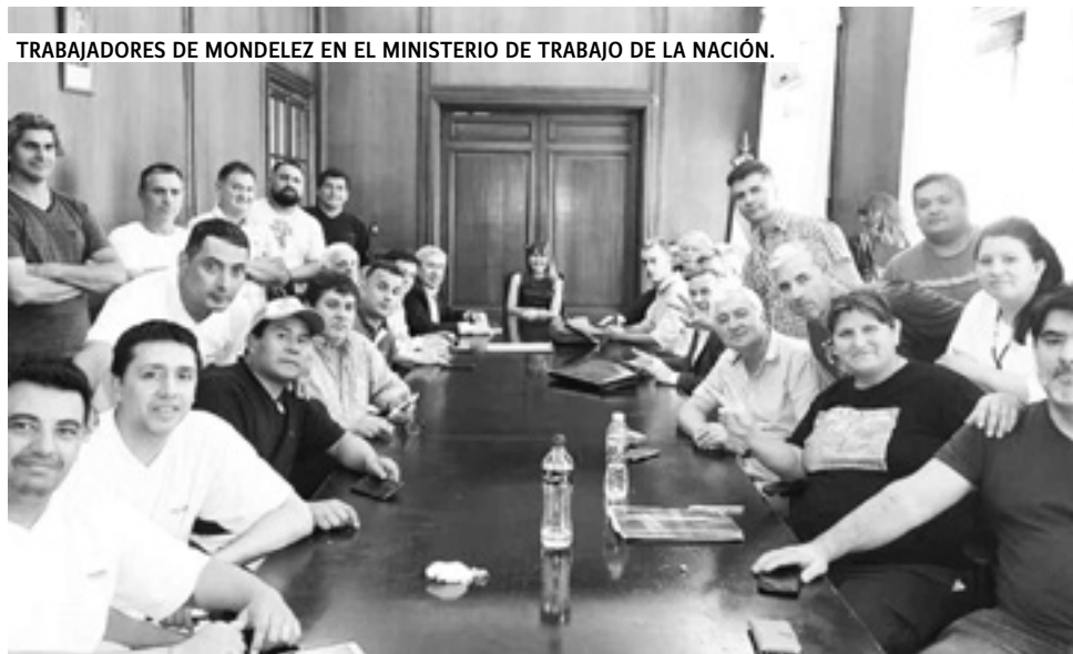
TRABAJADORES DE MONDELEZ EN EL MINISTERIO DE TRABAJO DE LA NACIÓN.

La audiencia del 21 fue la tercera en un mes. En este tiempo, las trabajadoras y trabajadores de Mondelez Pacheco discutieron en los sectores y las líneas la situación y cómo plantarse frente a