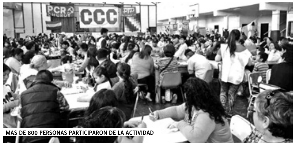
MAS DE 800 PERSONAS PARTICIPARON DE LA ACTIVIDAD

Tanto en el armado del salón, como luego en la limpieza del gimnasio, se destacó la organización y participación de los distintos grupos. El Cuerpo de Delega-