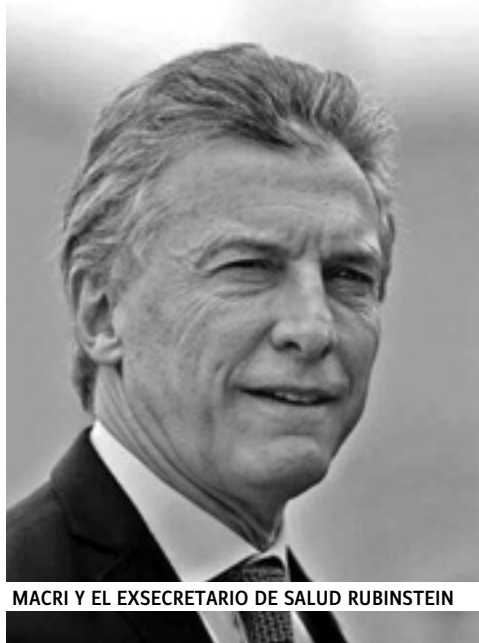
MACRI Y EL EXSECRETARIO DE SALUD RUBINSTEIN

Macri nos da la espalda y no escucha nuestros reclamos, él es principal responsable de cada una de las mujeres que mueren a causa de la clandestinidad del aborto, de cada niña obligada a parir y de cada mujer que sufre daños irreversibles en su salud por la práctica clandestina. En