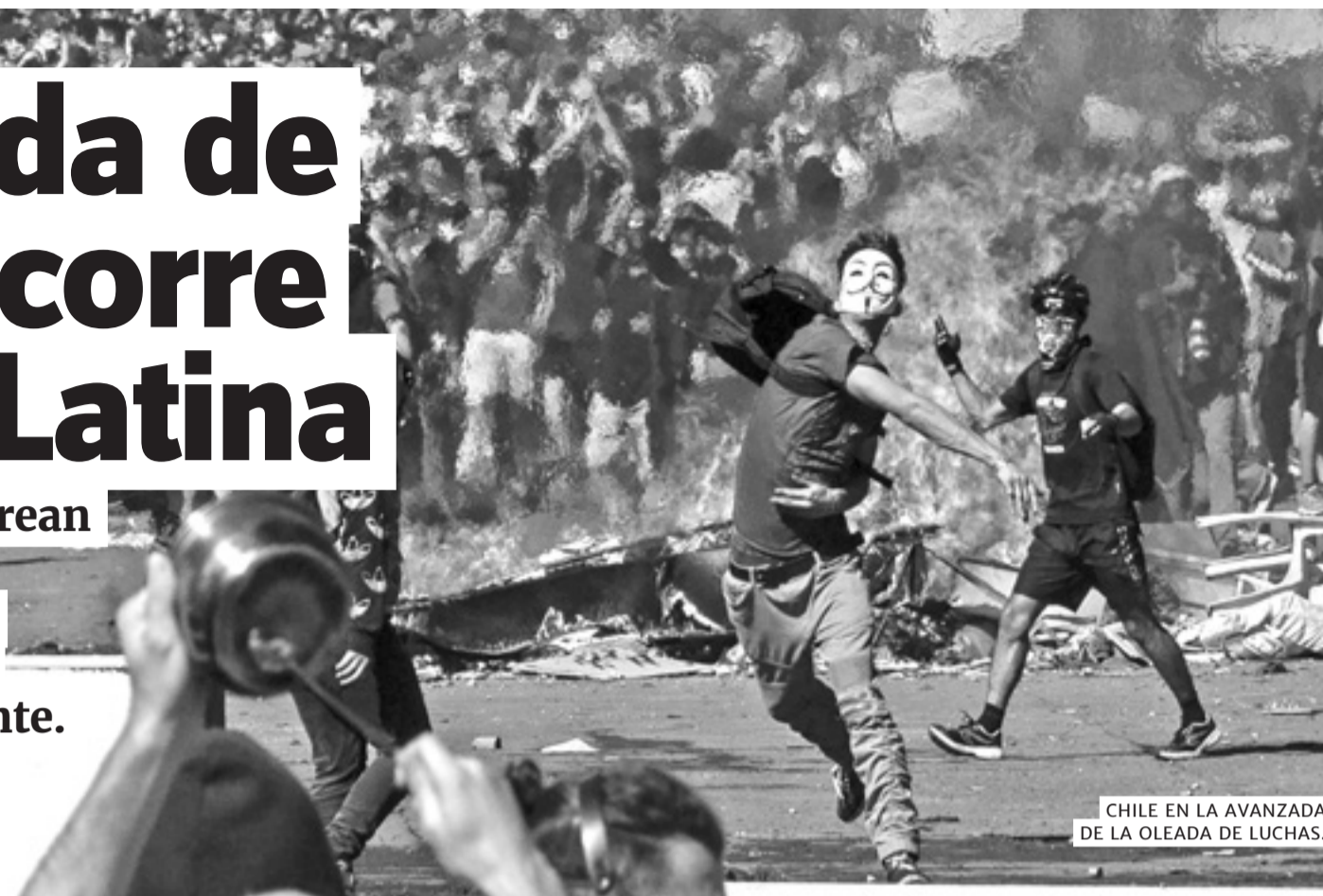
CHILE EN LA AVANZADA DE LA OLEADA DE LUCHAS.

Las rebeliones populares crean mejores condiciones para la lucha de nuestro pueblo y condicionan la situación política en todo el continente.