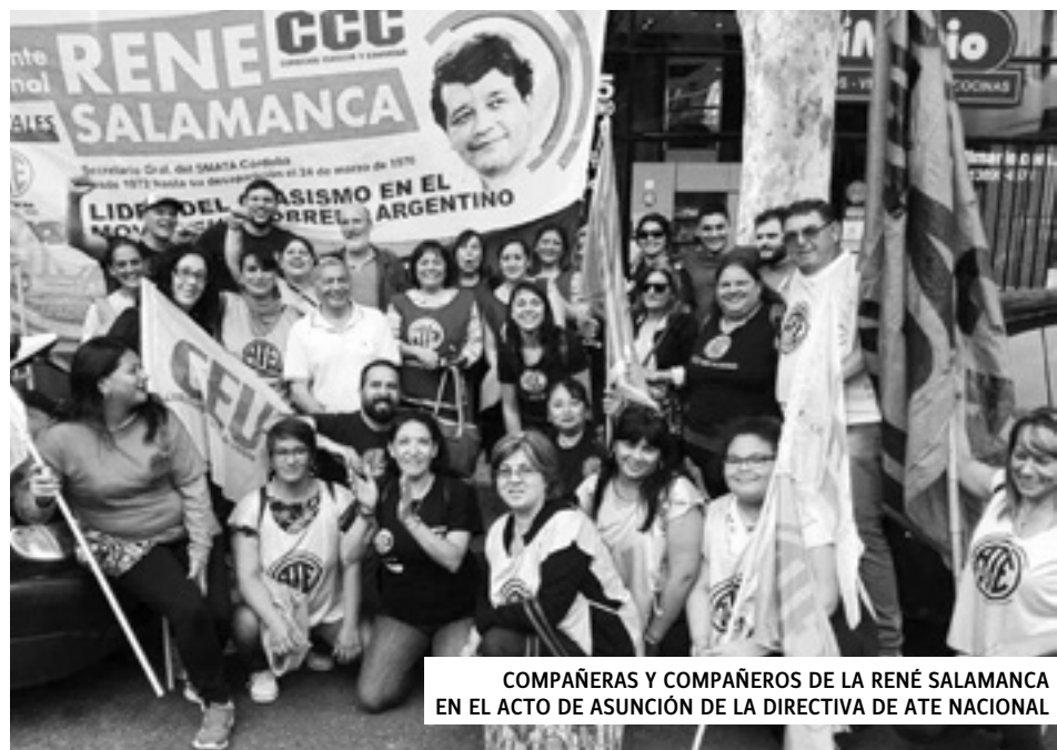
COMPAÑERAS Y COMPAÑEROS DE LA RENÉ SALAMANCA EN EL ACTO DE ASUNCIÓN DE LA DIRECTIVA DE ATE NACIONAL

Trabajamos para unir en un solo puño todas las luchas del movimiento obrero: ocupados, desocupados y jubilados para derrotar la política de hambre y miseria que empujan los monopolios como Mondelez y el gobierno macrista.