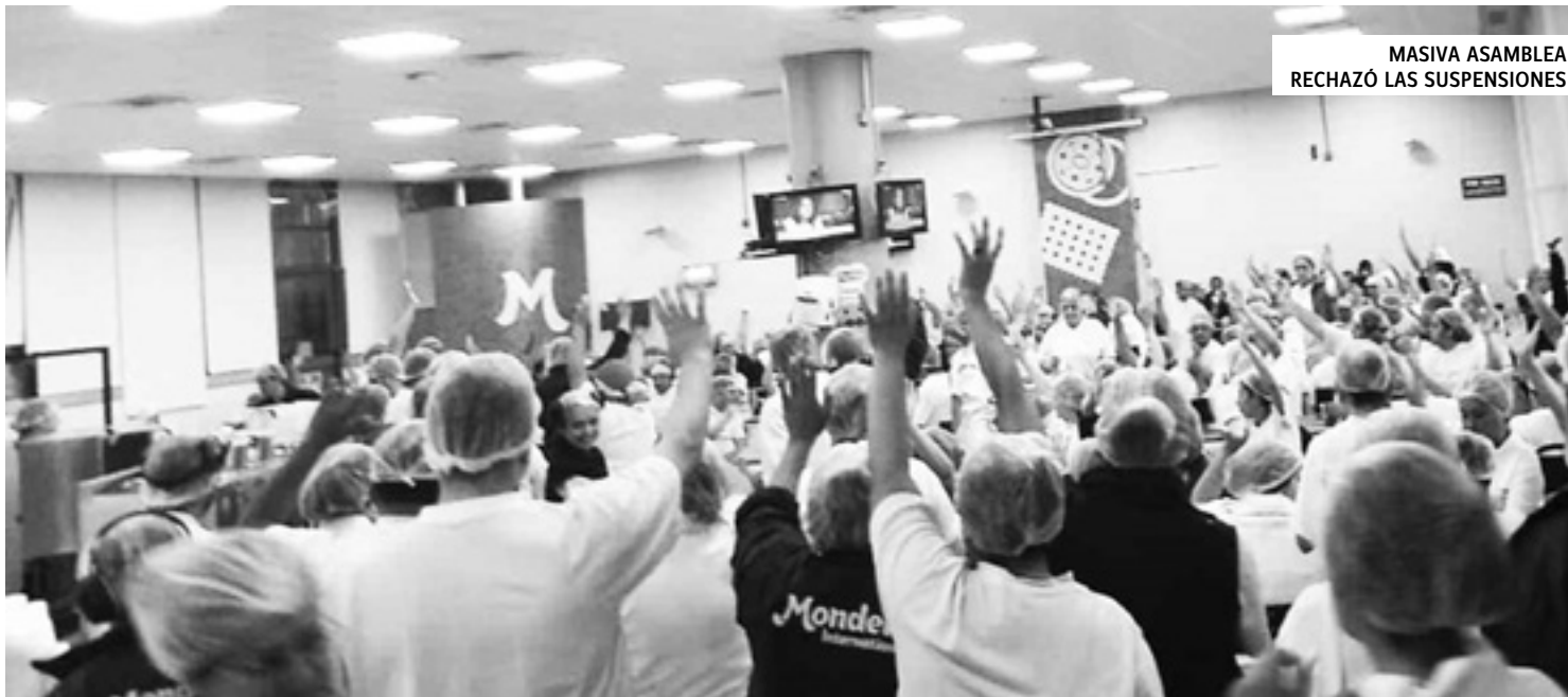
MASIVA ASAMBLEA RECHAZÓ LAS SUSPENSIONES