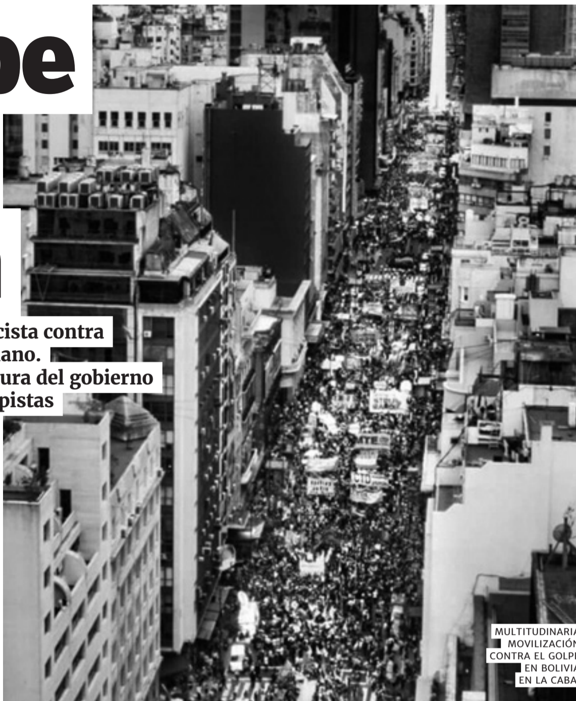
MULTITUDINARIA MOVILIZACIÓN CONTRA EL GOLPE EN BOLIVIA EN LA CABA.

La heroica lucha del pueblo boliviano contra el golpe de Estado racista y fascista, así como la heroica pelea del pueblo chileno contra el gobierno fascista de Piñera, nos une a todos los pueblos y naciones de América Latina.