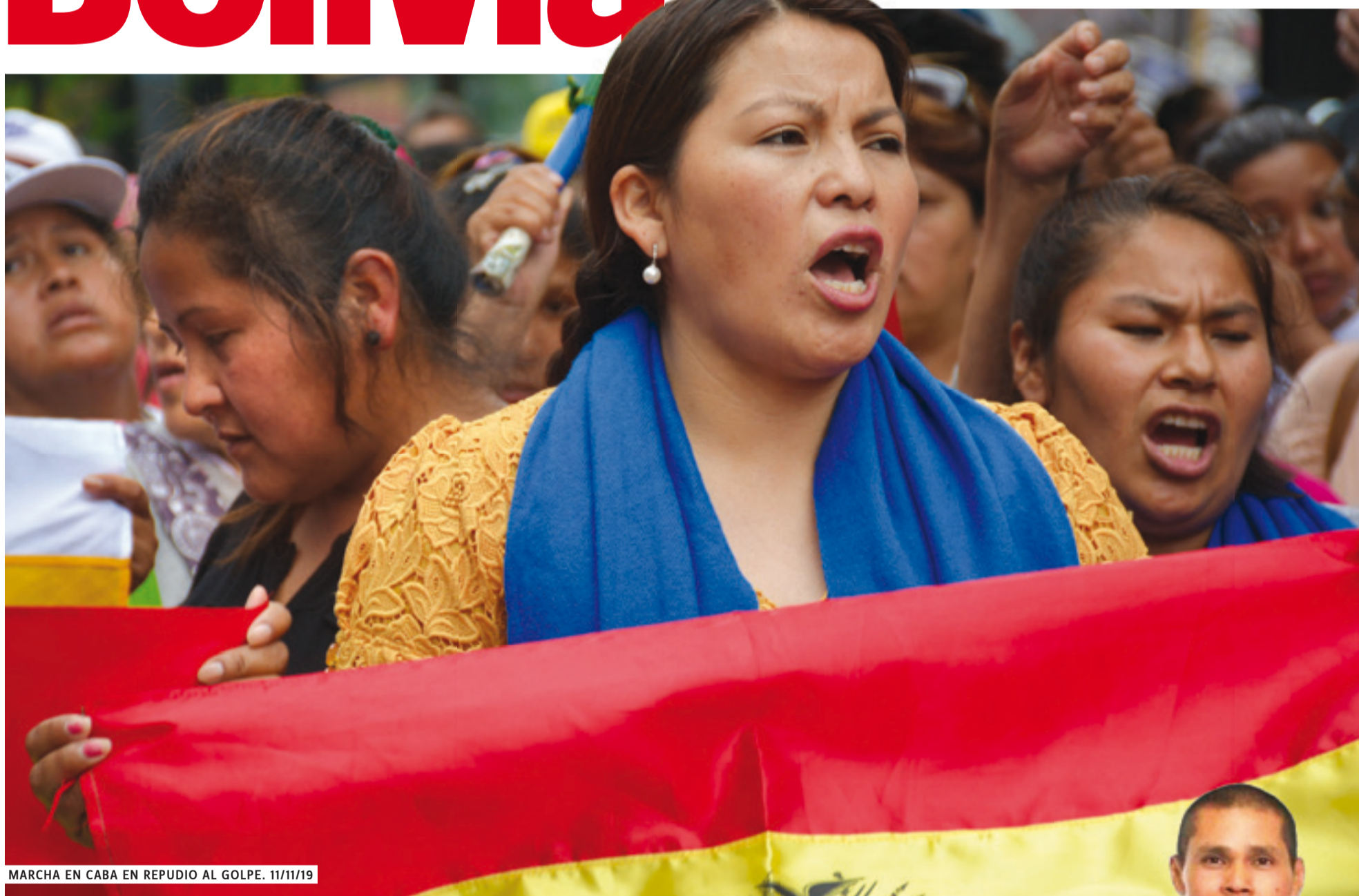
MARCHA EN CABA EN REPUDIO AL GOLPE. 11/11/19

Condenamos la servil postura del gobierno de Macri a favor de los golpistas