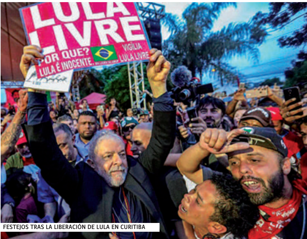
FESTEJOS TRAS LA LIBERACIÓN DE LULA EN CURITIBA

Lula estaba en prisión desde el 7 de abril