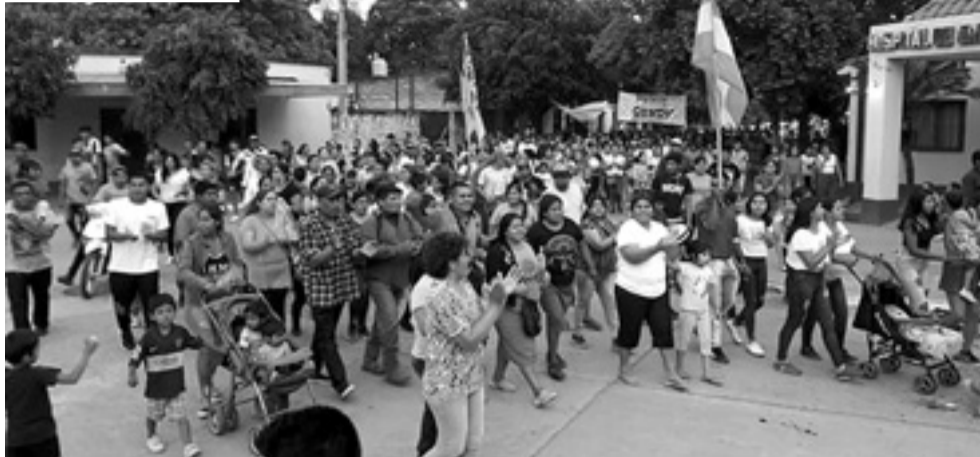
FESTEJOS EN URUNDEL