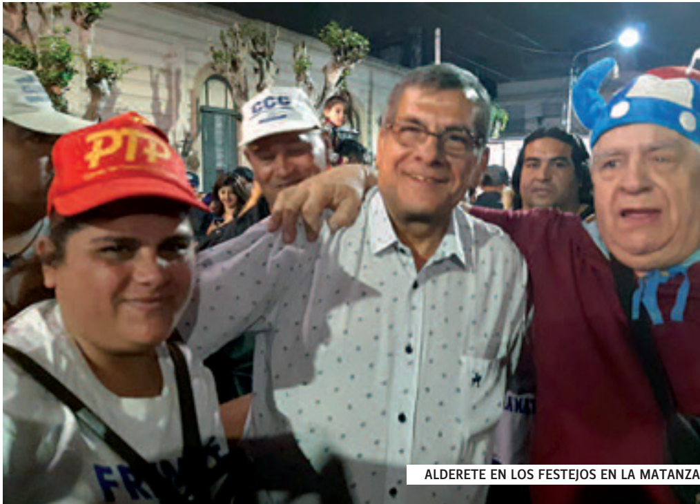
ALDERETE EN LOS FESTEJOS EN LA MATANZA

Desde temprano, integrantes de los más de 40 barrios que componen la organización se fueron acercando para disfrutar una jornada especial y festejar el triunfo del Frente de Todos. Con gran alegría, ya que hemos hecho una contribución importante para el mismo, producto del trabajo en conjunto realizado durante la campaña electoral por cientos de compañeros/as, tanto en las PASO del 11 de agosto como en las generales del 27 de octubre. Se vivió una verdadera fiesta, durante la cual se liberó la tensión contenida durante una campaña larga en la que se realizaron pintadas hasta altas horas de la noche, con frío y lluvia, pegatinas, volantes y en los barrios hablando con los vecinos y realizando múltiples actividades financieras para reunir el dinero para la campaña. La comida y la bebida la llevaron los diferentes barrios para compartir entre sus integrantes en una olla común.