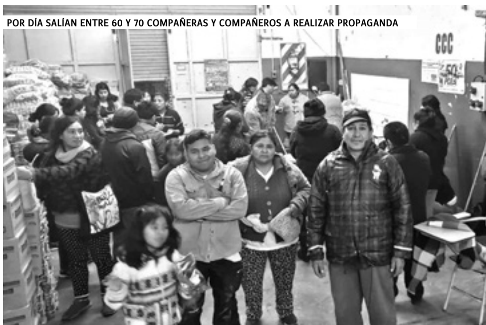
POR DÍA SALIAN ENTRE 60 Y 70 COMPAÑERAS Y COMPAÑEROS A REALIZAR PROPAGANDA

Planteamos mucho en la campaña que éramos la izquierda no gorila que reivindica el 17 de octubre, y que a Macri lo derrotamos con el pueblo peronista y la izquierda. Hicimos campaña en conjunto, y nos unimos más con los viejos peronistas y las nuevas camadas".