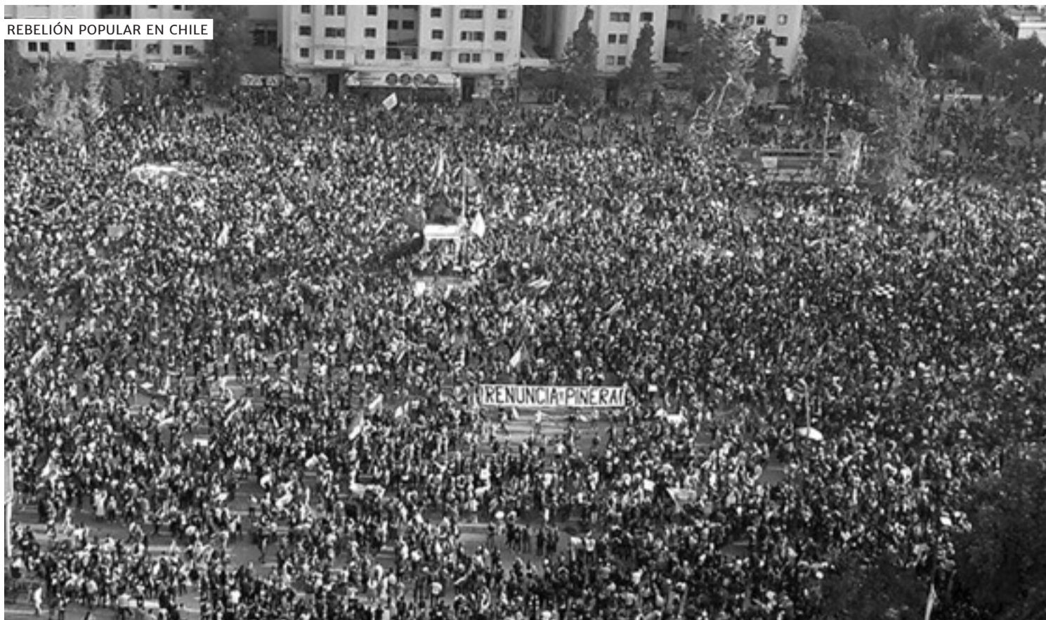
REBELIÓN POPULAR EN CHILE

Cambio ganó en seis (CABA, Córdoba, Santa Fe, Mendoza, San Luis y Entre Ríos). El Frente de Todos ganó en 18 provincias. Además, el Frente de Todos en Buenos Aires recuperó Quilmes, Berisso, Pilar, Morón y San Vicente, y gobernará en 71 municipios. Juntos por el Cambio, con el corte de boleta a gobernador y a presidente, mantuvo 61 intendencias, entre ellas La Plata, Mar del Plata, Bahía Blanca, Lanús, Tres de Febrero, San Miguel, San Isidro y Vicente López.