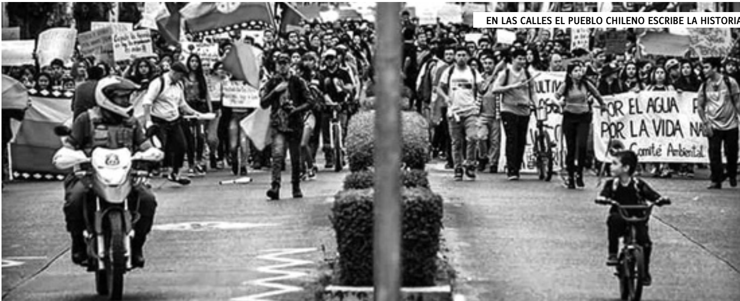
EN LAS CALLES EL PUEBLO CHILENO ESCRIBE LA HISTORIA

Entramos en la cuarta semana de intensas luchas en Chile. La movilización popular no se detiene, y día a día se suman nuevos sectores.