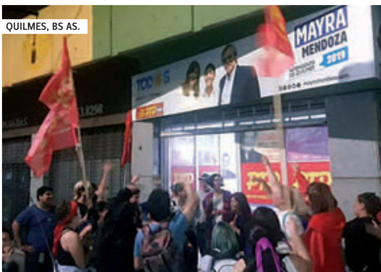
QUILMES, BS AS.