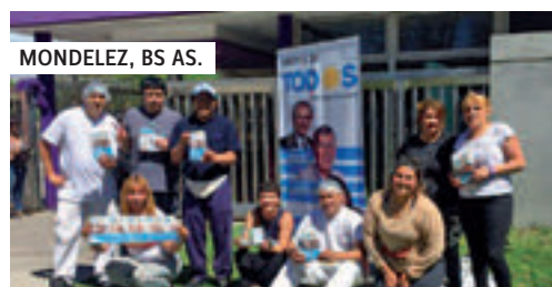
MONDELEZ, BS AS.