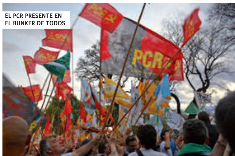
EL PCR PRESENTE EN EL BUNKER DE TODOS