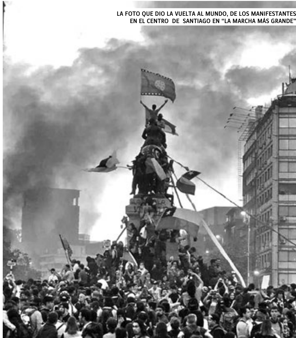
LA FOTO QUE DIO LA VUELTA AL MUNDO, DE LOS MANIFESTANTES EN EL CENTRO DE SANTIAGO EN "LA MARCHA MÁS GRANDE"

En estos años, el "modelo chileno" estuvo cuestionado por gran cantidad de luchas parciales. Hubo masivas marchas por el cambio en el sistema de jubilaciones privatizadas, luchas estudiantiles reclamando la gratuidad de la enseñanza, reclamos de muchos sectores de trabajadores, así como recrudesció el histórico reclamo del pueblo mapuche. En los últimos tiempos, "las luchas de las mujeres han llevado la batuta en el movimiento popular y han visibilizado la profunda desigualdad entre hombres y mujeres", escribe un protagonista de las últimas manifestaciones.