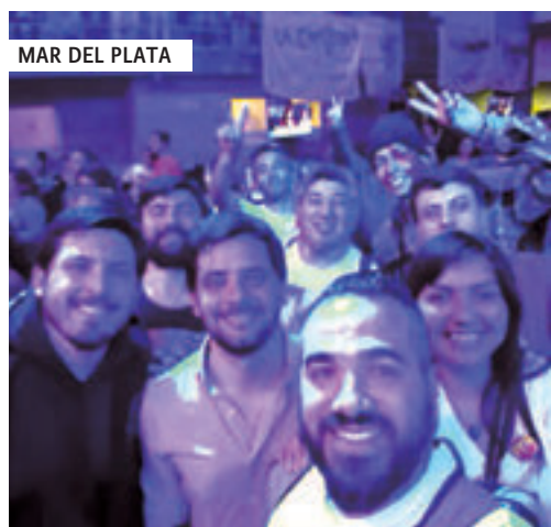
MAR DEL PLATA