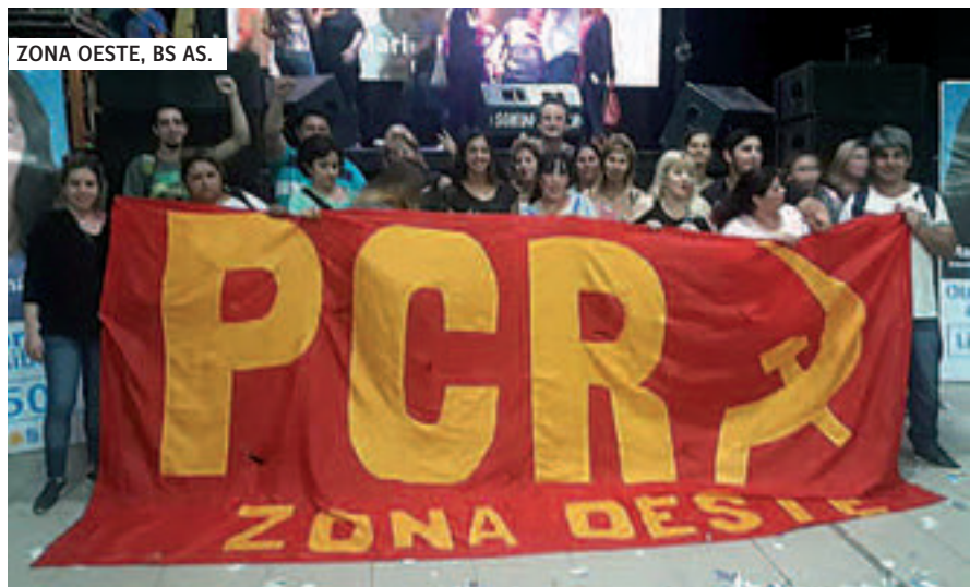
ZONA OESTE, BS AS.