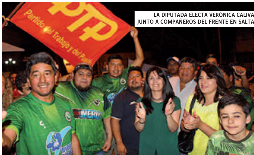
LA DIPUTADA ELECTA VERÓNICA CALIVA JUNTO A COMPAÑEROS DEL FRENTE EN SALTA