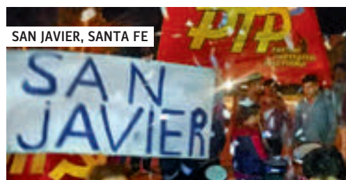
SAN JAVIER, SANTA FE