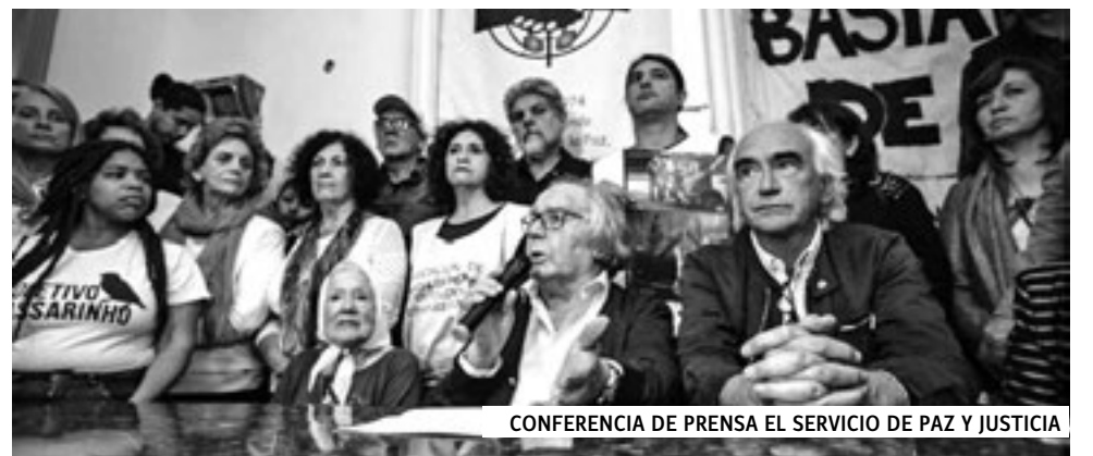
CONFERENCIA DE PRENSA EL SERVICIO DE PAZ Y JUSTICIA

Estaban presentes, junto al Premio Nobel de la Paz, Adolfo Pérez Esquivel y la titular de las Madres de Plaza de Mayo Línea Fundadora, Nora Cortiñas, dirigentes de varias organizaciones populares como la CTA Autónoma, ATE, la Corriente Cla-