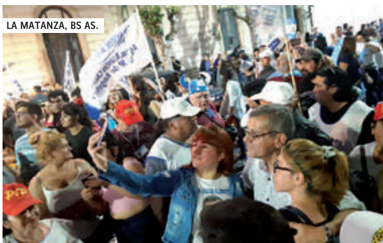
LA MATANZA, BS AS.