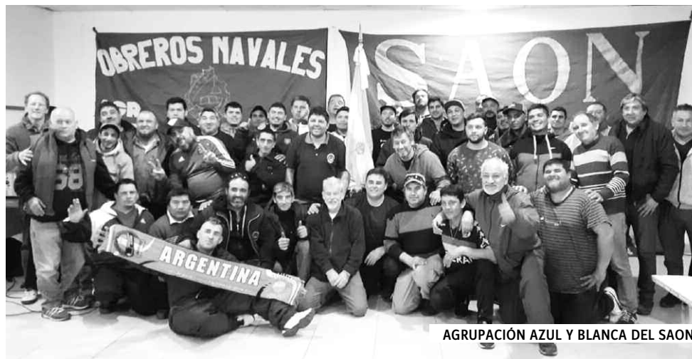
AGRUPACIÓN AZUL Y BLANCA DEL SAON

señalamos esto y desde el principio apoyamos el accionar del 21F. Esta unidad es muy fuerte y marcó el ritmo de la lucha sindical junto a los movimientos populares. Expresa la unidad de sectores combativos con aquellos que tienen una fuerte influencia en la teoría social de la iglesia impulsada por el Papa Francisco.