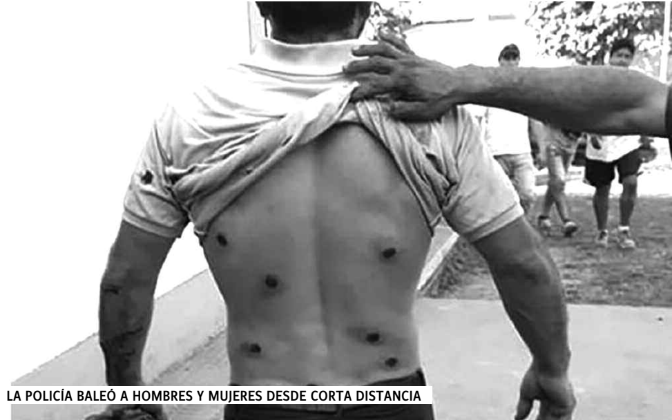
LA POLICÍA BALEÓ A HOMBRES Y MUJERES DESDE CORTA DISTANCIA

La agrupación 8 de Octubre viene luchando contra esta situación y dice en su comunicado "La conducción macrista de