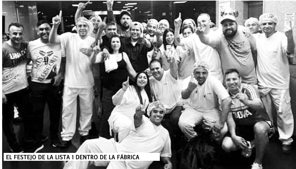
EL FESTEJO DE LA LISTA 1 DENTRO DE LA FÁBRICA

Nosotros veníamos planteando que la discusión era política, porque la discusión es con Macri. A nosotros el salario se nos devaluó en un 50% en un año. Y tenés la discusión día a día con los puestos de trabajo, el crecimiento de las enfermedades profesionales dentro de la fábrica, el poder sacarle algo a la fábrica todos los días, es una pelea constante. Y si te sectarizás y quedás aislado, los compañeros no avan-