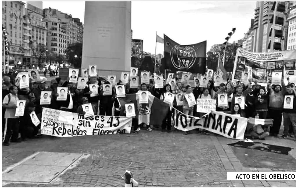
ACTO EN EL OBELISCO

Esa noche fueron secuestrados 43 estudiantes, además de los heridos y torturados. Hasta el día de hoy no hay certezas sobre qué pasó con los 43 de Ayotzinapa, aunque lo más probable es que hayan si-