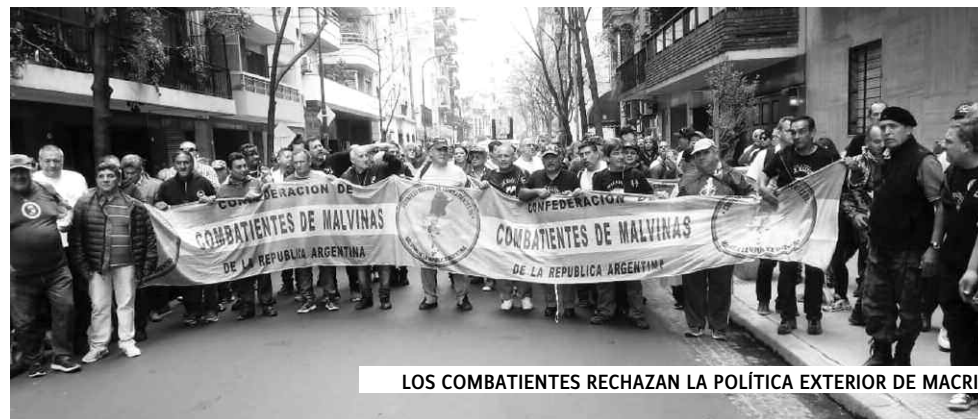
LOS COMBATIENTES RECHAZAN LA POLÍTICA EXTERIOR DE MACRI

Luego Rada se refirió a la reunión con el juez que tiene a su cargo el reclamo contra Anses por los derechos no recono-