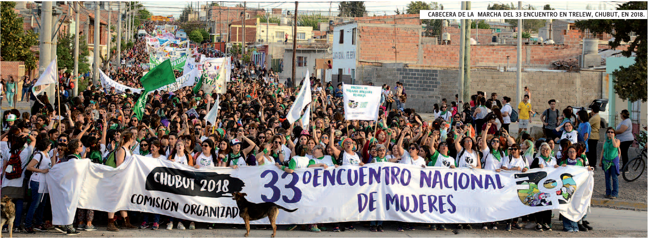
CABECERA DE LA MARCHA DEL 33 ENCUENTRO EN TRELEW, CHUBUT, EN 2018.

El 12, 13 y 14 de octubre se realizará el 34 Encuentro Nacional de Mujeres en la ciudad de La Plata.