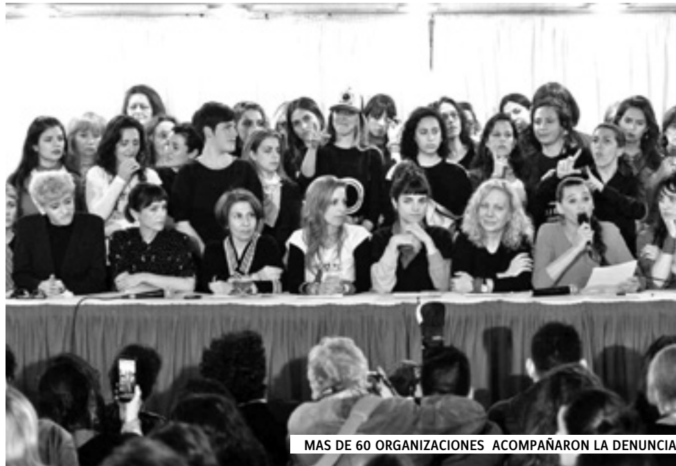
MAS DE 60 ORGANIZACIONES ACOMPAÑARON LA DENUNCIA