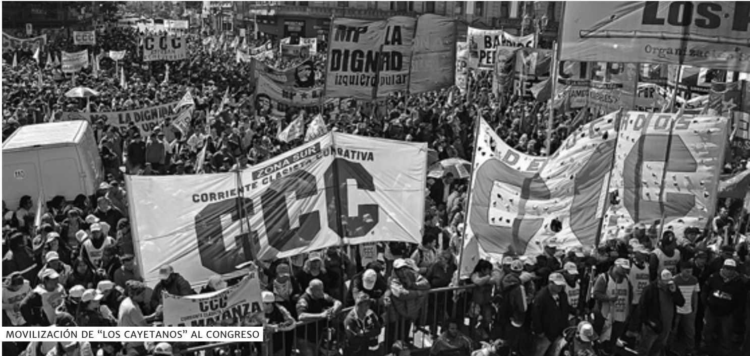
MOVILIZACIÓN DE "LOS CAYETANOS" AL CONGRESO

El jueves 12 de septiembre, con un Congreso rodeado por decenas de miles de personas, la Cámara de Diputados aprobó la Emergencia Alimentaria, que aumenta en un 50% las partidas para los comedores escolares y populares. El 18 la trata el Senado.