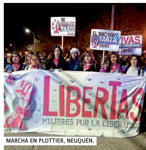
MARCHA EN PLOTTIER, NEUQUÉN.

En Plottier, el lunes marcharon más de 10