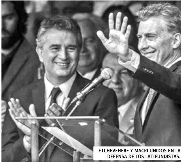
ETCHEVEHERE Y MACRI UNIDOS EN LA DEFENSA DE LOS LATIFUNDISTAS.

El ministro Etchevehere consideró que “no son casuales” las declaraciones formuladas en favor de una reforma agraria por el dirigente de la Confederación de Trabajadores de la Economía Popular (CTEP), Juan Grabois, “a las que se sumó luego (el dirigente del Movimiento Evita Emilio) Pérsico”. El ministro las asoció además con las declaraciones anteriores del ex gobernador bonaerense Felipe Solá, sobre la ne-