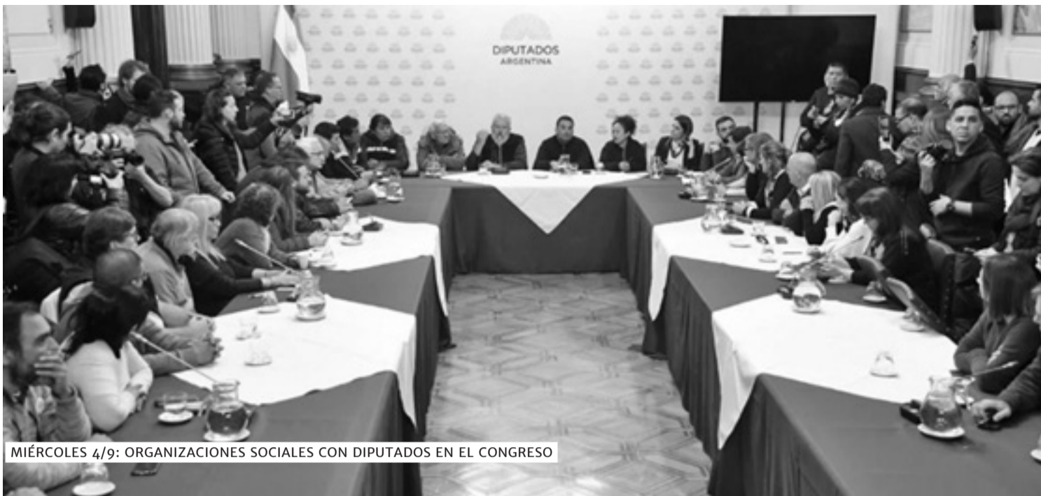
MIÉRCOLES 4/9: ORGANIZACIONES SOCIALES CON DIPUTADOS EN EL CONGRESO

Miles de compañeras y compañeros de los movimientos sociales marcharon al Congreso de la Nación para reclamar el urgente tratamiento de la ley de emergencia alimentaria. Los dirigentes fueron recibidos por legisladores opositores. El 12/9 se trata la emergencia en Diputados.