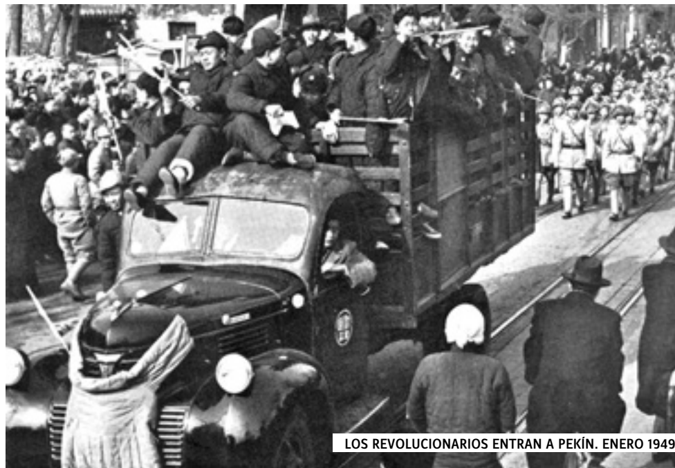
LOS REVOLUCIONARIOS ENTRAN A PEKÍN. ENERO 1949

Finalizada la segunda guerra mundial [en 1945], Estados Unidos y su aliado menor, Gran Bretaña, habían desatado la así llamada "guerra fría", una especie de gran cruzada anticomunista, que se combinaba con atroces matanzas contra los pueblos que luchaban por su independencia, con la restauración reaccionaria como el caso de Grecia, con la recuperación de los restos del fascismo en el camino de fortalecer un mundo que se proclamaba occidental y cristiano, con el permanente chantaje de una bomba atómica monopolizada por el imperialismo yanqui, con la expansión aparentemente sin límite de los monopolios de Estados Unidos. Era la preparación de una tercera guerra mundial. Por otra parte, tanto la Unión Soviética como las democracias del pueblo de Europa oriental tenían gran parte de sus fuerzas destinadas a restaurar sus economías devastadas por la contienda.