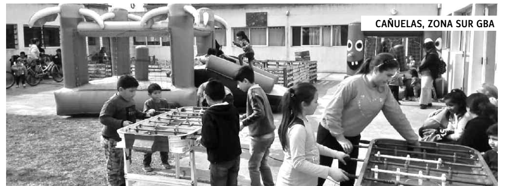
CAÑUELAS, ZONA SUR GBA

Compañeras de la CCC y del PTP hicieron una hermosa fiesta a la que asistieron cerca de 150 chicos y sus familias. Se realizó en el Centro de Integración Comunitaria de Máximo Paz. Los chicos disfruta-