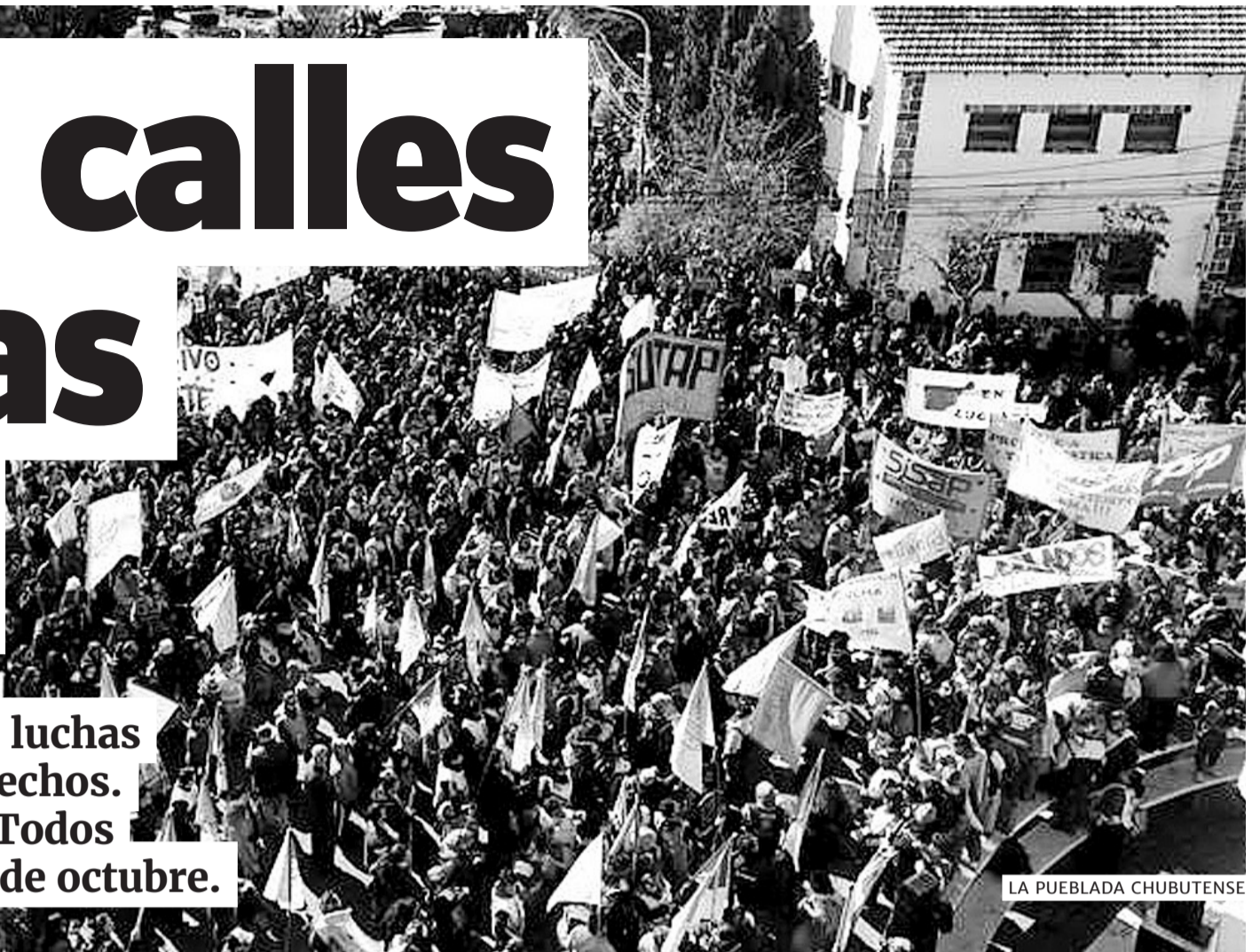
LA PUEBLADA CHUBUTENSE