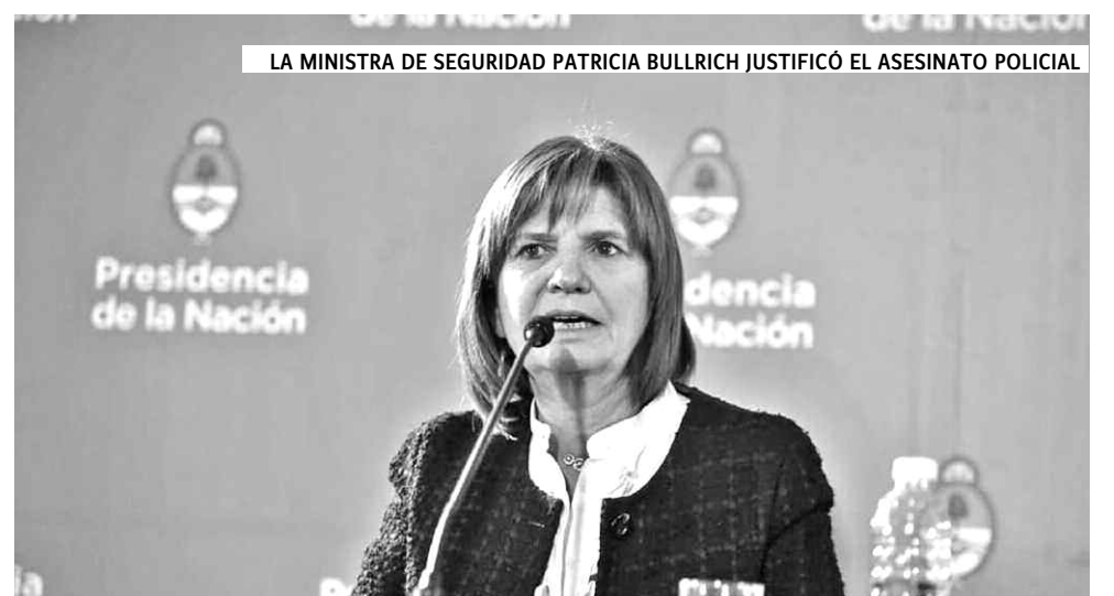
LA MINISTRA DE SEGURIDAD PATRICIA BULLRICH JUSTIFICÓ EL ASESINATO POLICIAL

El gobierno de la Ciudad es un fiel discípulo de la política macrista, y Larreta, calladito porque está en campaña electoral, es el principal responsable en CABA de este aumento de la brutalidad policial, como parte de su política de hambre y ajuste, que no pasa sin represión. ■