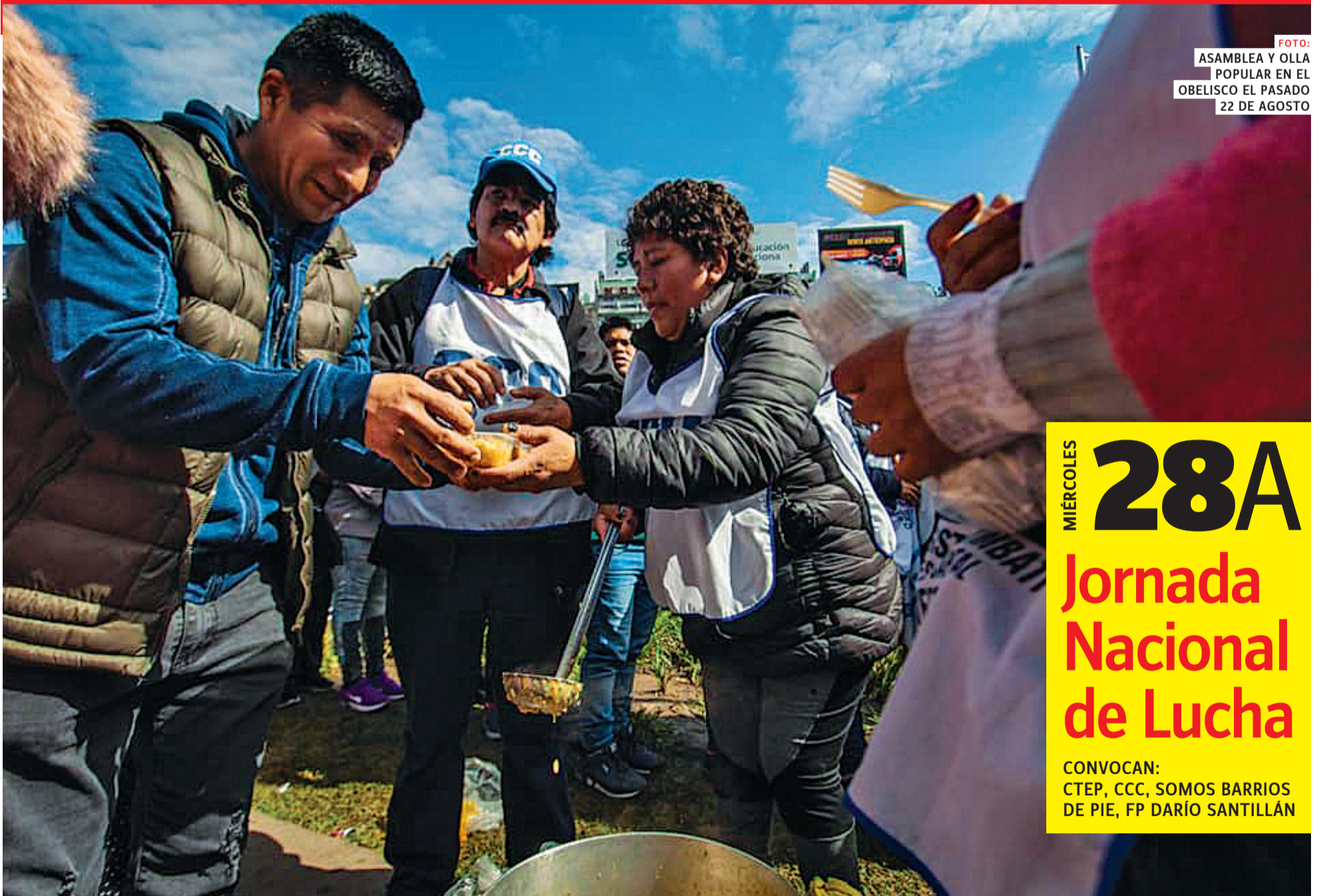
FOTO: ASAMBLEA Y OLLA POPULAR EN EL OBELISCO EL PASADO 22 DE AGOSTO

Redoblar la campaña electoral del Frente de Todos para derrotar esta política y este gobierno en las elecciones de octubre. Avanzar con la unidad en las calles y en las urnas.