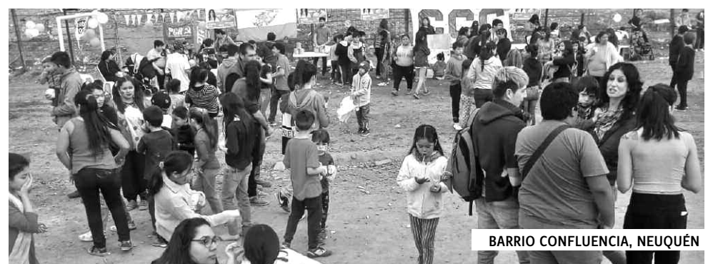
BARRIO CONFLUENCIA, NEUQUÉN

ron de juegos, peloteros, metegol, disfraces, globos, premios y merienda, gracias