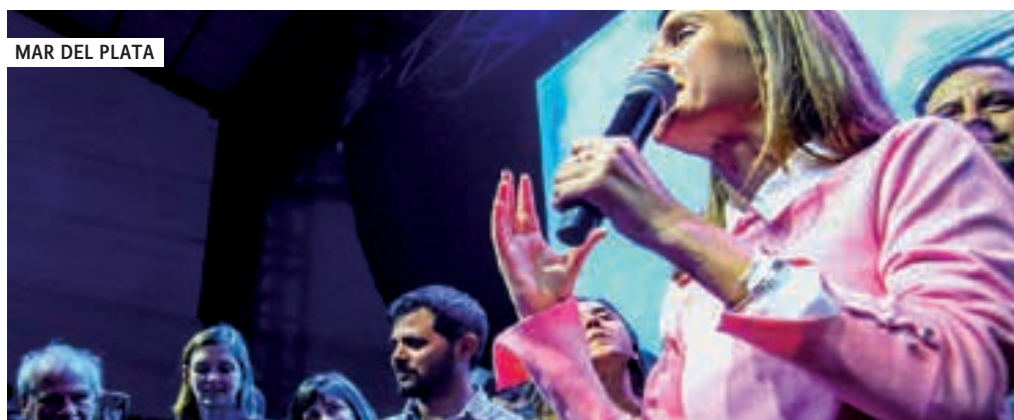
MAR DEL PLATA

En la interna de Todos se impuso la Lista 14 que ganó con 39.000 votos (25 %) al actual intendente Festa que sacó menos de 30.000 votos (19%). El total de las 7 listas que compitieron dentro del Frente de Todos fue 155.000 votos (63 %) contra 49.000 (20%) de Cambiemos, números que se repiten en las categorías a presidente y gobernador. Moreno fue parte del contundente castigo popular a la política de Macri y Vidal. El resultado corona un proceso de avance de las fuerzas que vinimos gestando esta unidad desde hace años en el dis-