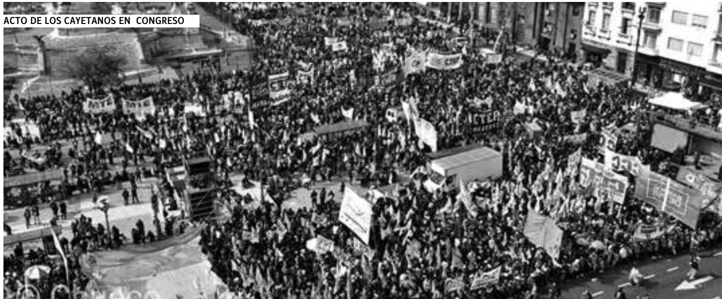
ACTO DE LOS CAYETANOS EN CONGRESO

de una obra, algunos vecinos salían con banderas argentinas.