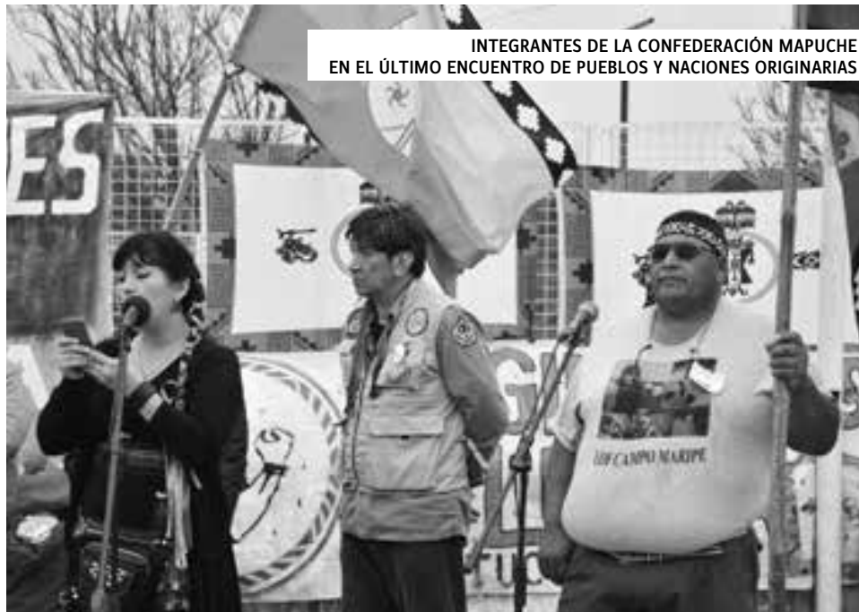
INTEGRANTES DE LA CONFEDERACIÓN MAPUCHE EN EL ÚLTIMO ENCUENTRO DE PUEBLOS Y NACIONES ORIGINARIAS

La sorpresa agradable para nuestra realidad como pueblo nación mapuche fue que del análisis de las serias condiciones de atropellos, represión y criminalización, se designó a Neuquén como sede del próximo Encuentro. Esto surgió a partir de analizar lo que ocurre en Neuquén desde dos casos emblemáticos: la lucha de las comunidades ante los