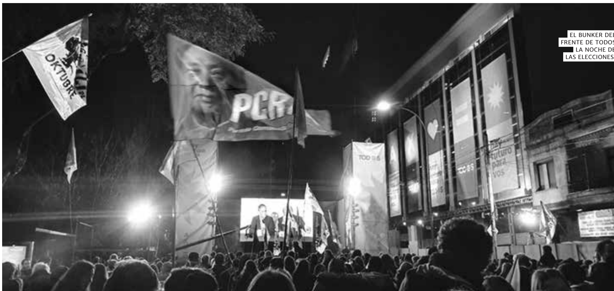
EL BUNKER DEL FRENTE DE TODOS LA NOCHE DE LAS ELECCIONES.