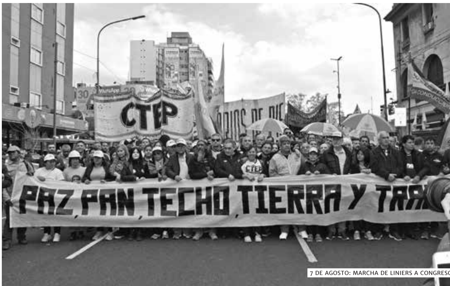
7 DE AGOSTO: MARCHA DE LINIERS A CONGRESO