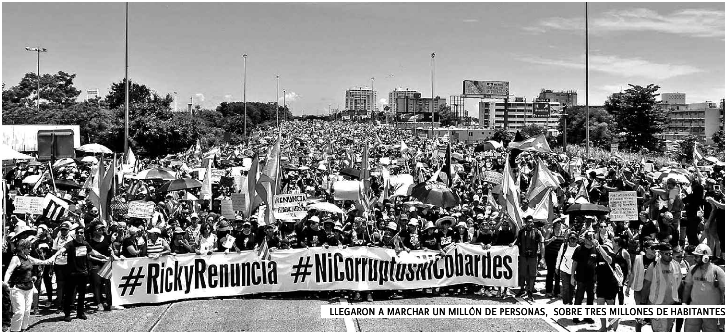
LLEGARON A MARCHAR UN MILLÓN DE PERSONAS, SOBRE TRES MILLONES DE HABITANTES

Reproducimos una nota publicada en el sitio de la revista de nuestra Juventud Comunista Revolucionaria, revistachispa.org