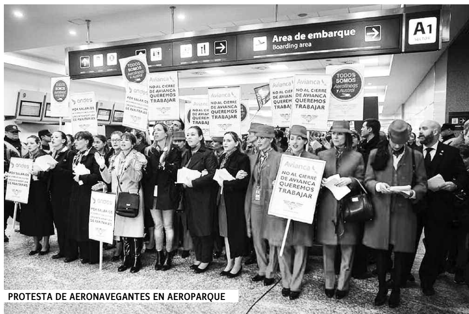
PROTESTA DE AERONAVEGANTES EN AEROPARQUE

El centro de la crítica está destinado a lo que el gobierno llama "política de cielos abiertos", que en la realidad es un proceso de achique brutal de Aerolíneas Argentinas, nuestra línea de bandera, en beneficio de empresas privadas y particularmente monopolios extranjeros. Los gremios (Asociación de Personal Aeronáutico-APA, Asociación de Pilotos de Líneas Aéreas-APLA, Asociación Técnicos y Empleados de Protección y Seguridad a la Aeronavegación-Atepsa, Unión de Aviadadores de Líneas Aéreas-UALA y Unión Personal Superior Aeronáutico-UPSA), han presentado en el Senado un proyecto de