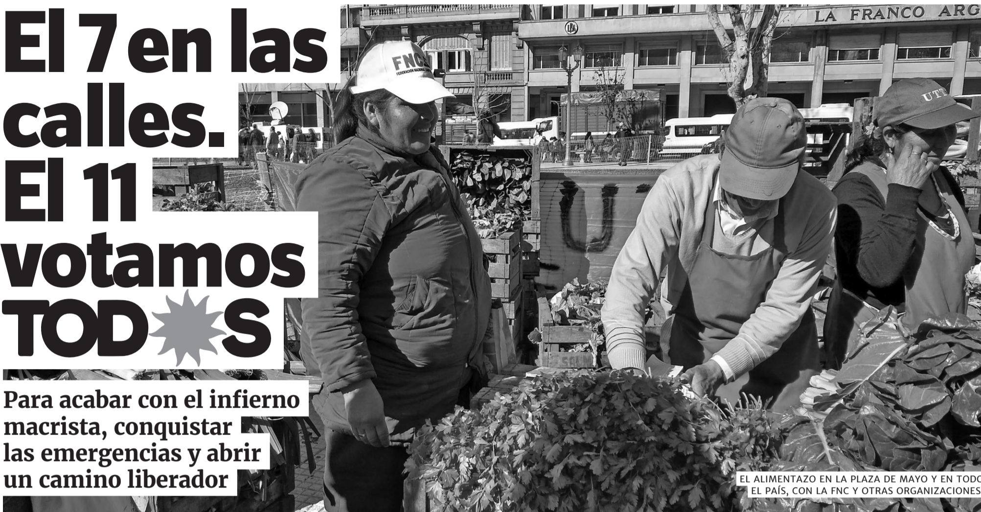
EL ALIMENTAZO EN LA PLAZA DE MAYO Y EN TODO EL PAÍS, CON LA FNC Y OTRAS ORGANIZACIONES.