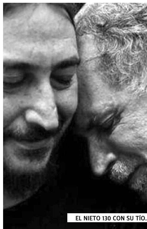
EL NIETO 130 CON SU TÍO.

Elena fue secuestrada, y el bebé aparentemente dejado en la calle, en el barrio de Belgrano de la Capital Federal. Fue entregado a la policía y entró al sistema