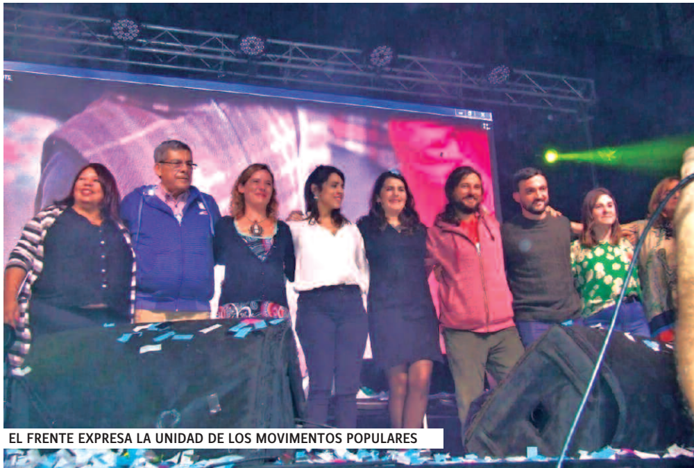
EL FRENTE EXPRESA LA UNIDAD DE LOS MOVIMIENTOS POPULARES

El miércoles 12 de junio se hizo el lanzamiento del Frente Otro Moreno Es Posible. El acto se realizó en el teatro Roma, que desbordó con más de dos mil compañeras y compañeros, y fue seguido por muchos afuera con pantalla gigante y sonido.