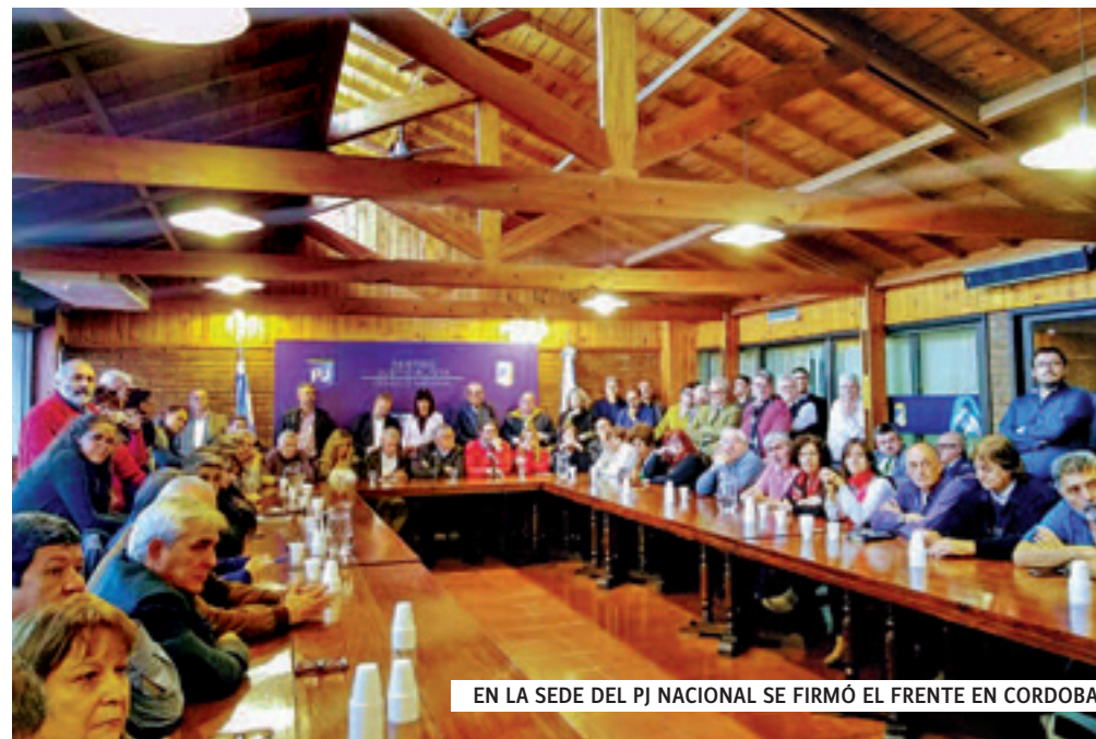
EN LA SEDE DEL PJ NACIONAL SE FIRMÓ EL FRENTE EN CORDOBA