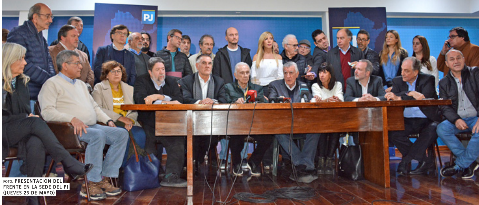
FOTO: PRESENTACIÓN DEL FRENTE EN LA SEDE DEL PJ (JUEVES 23 DE MAYO)