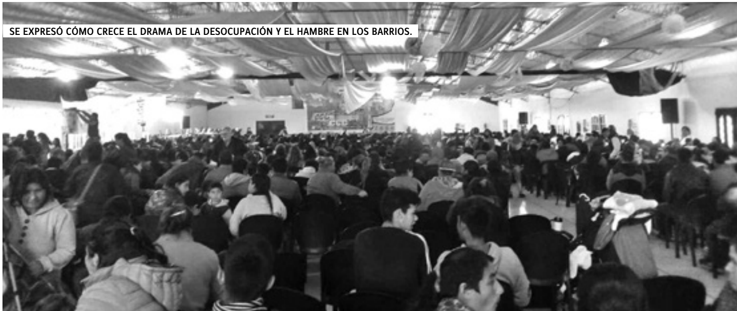
SE EXPRESÓ CÓMO CRECE EL DRAMA DE LA DESOCUPACIÓN Y EL HAMBRE EN LOS BARRIOS.