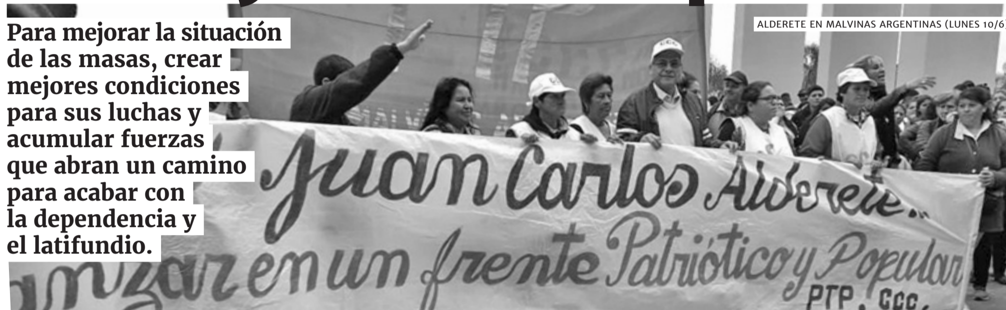
ALDERETE EN MALVINAS ARGENTINAS (LUNES 10/6)

Impulsamos y somos parte del frente patriótico para derrotar al macrismo para mejorar la situación de las masas y para crear mejores condiciones para la lucha popular. En la calle y en las elecciones, acumulamos fuerzas para acabar con la dependencia y el latifundio y conquistar la patria nueva que nos merecemos.■