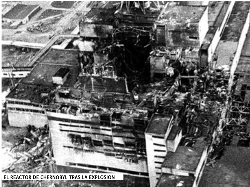
EL REACTOR DE CHERNOBYL TRAS LA EXPLOSIÓN