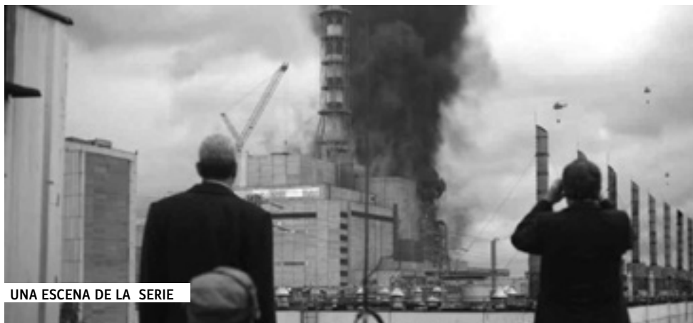
UNA ESCENA DE LA SERIE

las características de este proceso (ver sus tres tomos de Revolución, restauración y crisis en la Unión Soviética ).