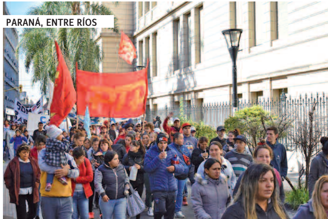
PARANÁ, ENTRE RÍOS