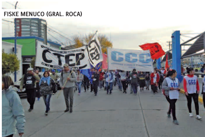
FISKE MENUCO (GRAL. ROCA)