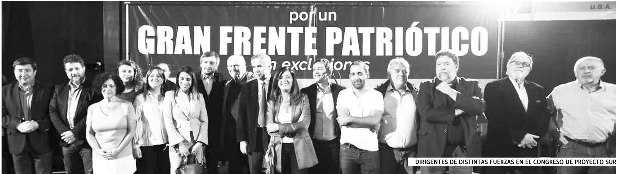
DIRIGENTES DE DISTINTAS FUERZAS EN EL CONGRESO DE PROYECTO SUR

El jueves 2 de mayo en el Aula Magna de la Facultad de Medicina de la UBA se realizó el Congreso da Proyecto Sur, que llamó a conformar un "frente patriótico" para derrotar a Macri.