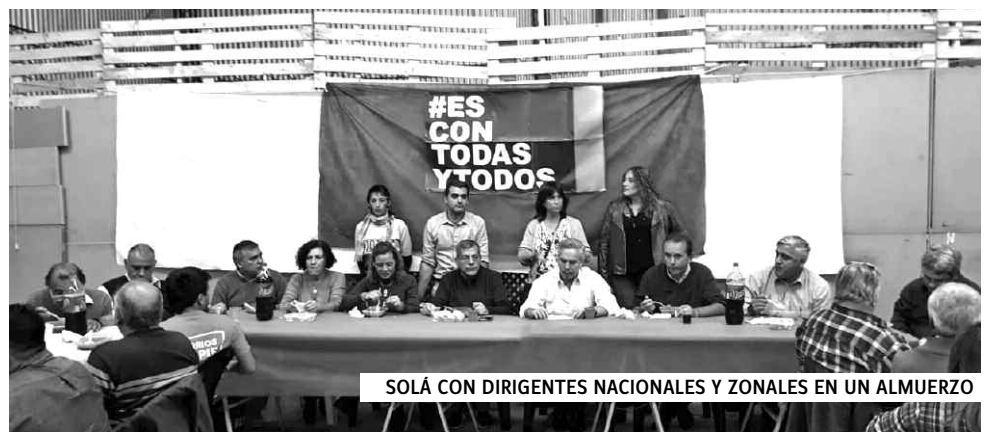
SOLÁ CON DIRIGENTES NACIONALES Y ZONALES EN UN ALMUERZO

Cerró el acto Solá, reivindicando la necesidad de ampliar la unidad para derrotar a Macri en las urnas. ■