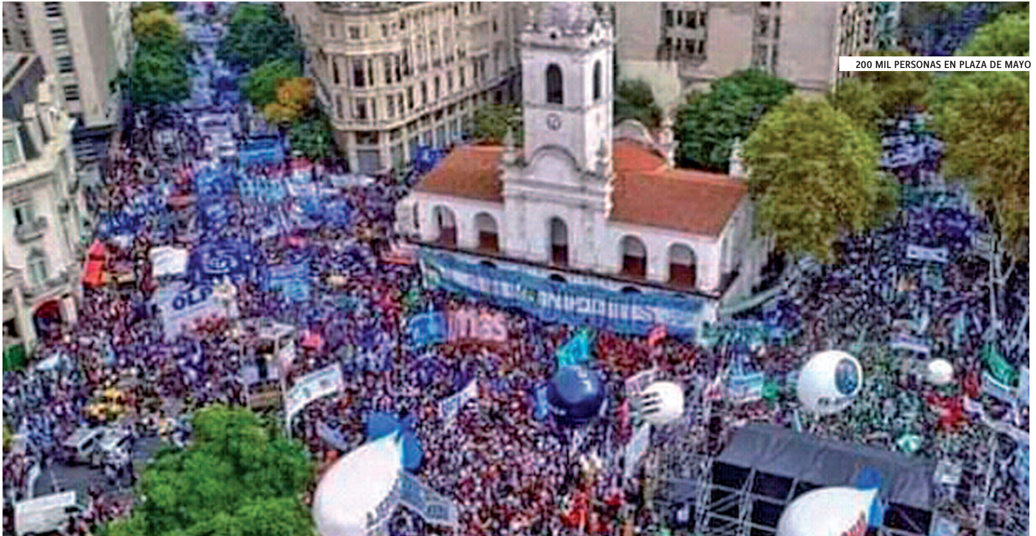
200 MIL PERSONAS EN PLAZA DE MAYO

El 30 de abril se llevó a cabo un gran paro con actos y cortes en todo el país, contra la política de pobreza y entrega nacional del gobierno de Macri. El 1 de Mayo hubo ollas populares.