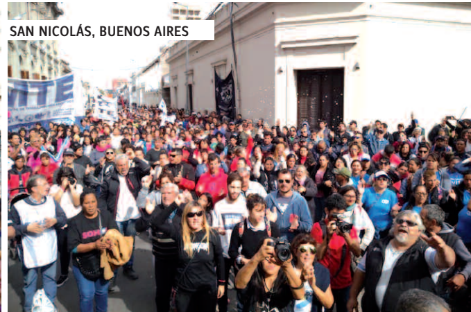
SAN NICOLÁS, BUENOS AIRES