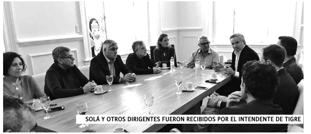
SOLÁ Y OTROS DIRIGENTES FUERON RECIBIDOS POR EL INTENDENTE DE TIGRE