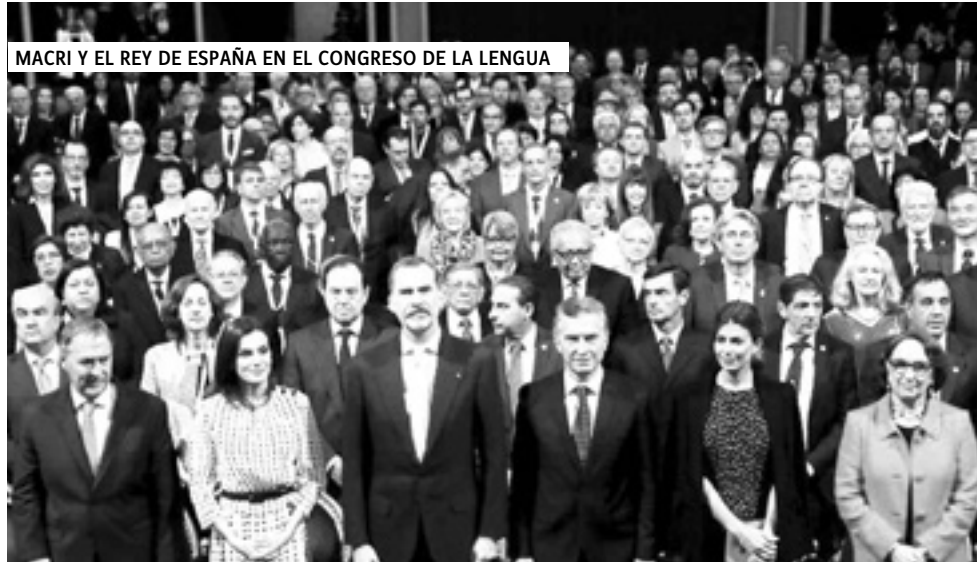
MACRI Y EL REY DE ESPAÑA EN EL CONGRESO DE LA LENGUA

Sin embargo, y aunque la RAE pretenda sostener que su español es la única len-