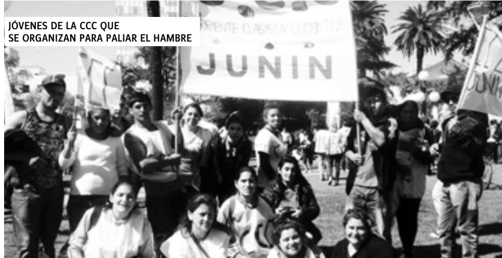
JÓVENES DE LA CCC QUE SE ORGANIZAN PARA PALIAR EL HAMBRE