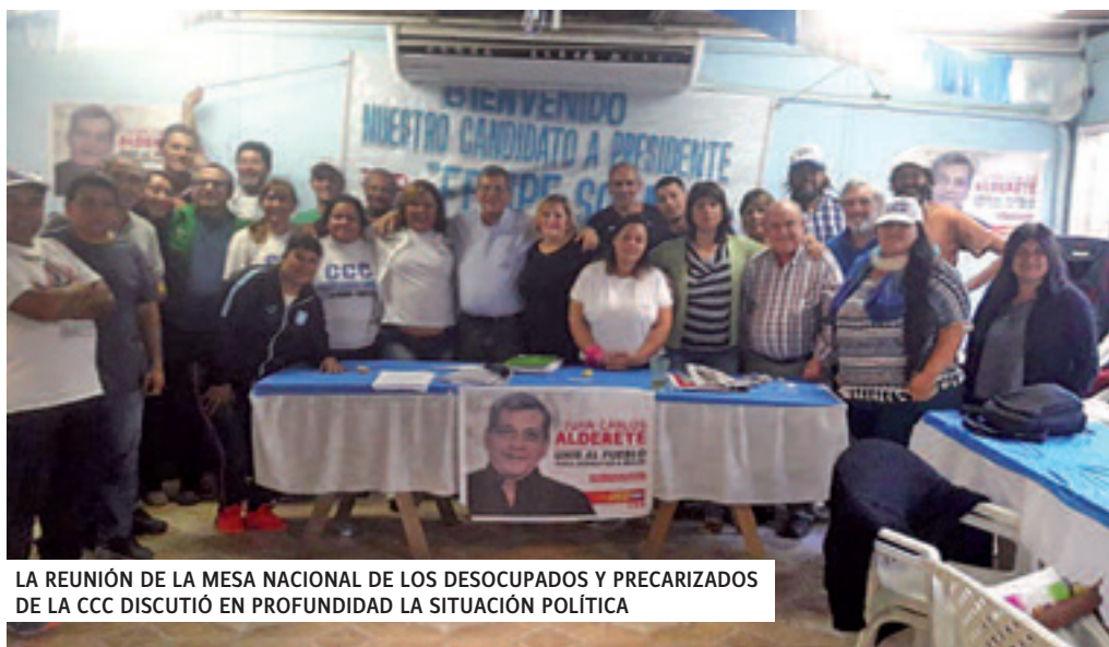
LA REUNIÓN DE LA MESA NACIONAL DE LOS DESOCUPADOS Y PRECARIZADOS DE LA CCC DISCUTIÓ EN PROFUNDIDAD LA SITUACIÓN POLÍTICA

“Hemos discutido todas las luchas que se han realizado desde el plenario hasta acá, así como el proceso que ha llevado armar el frente político armado por los Cayetanos, reforzando la relación, porque gracias a esto es que hemos logrado armar el frente En marcha , y se han sumado fuerzas como la