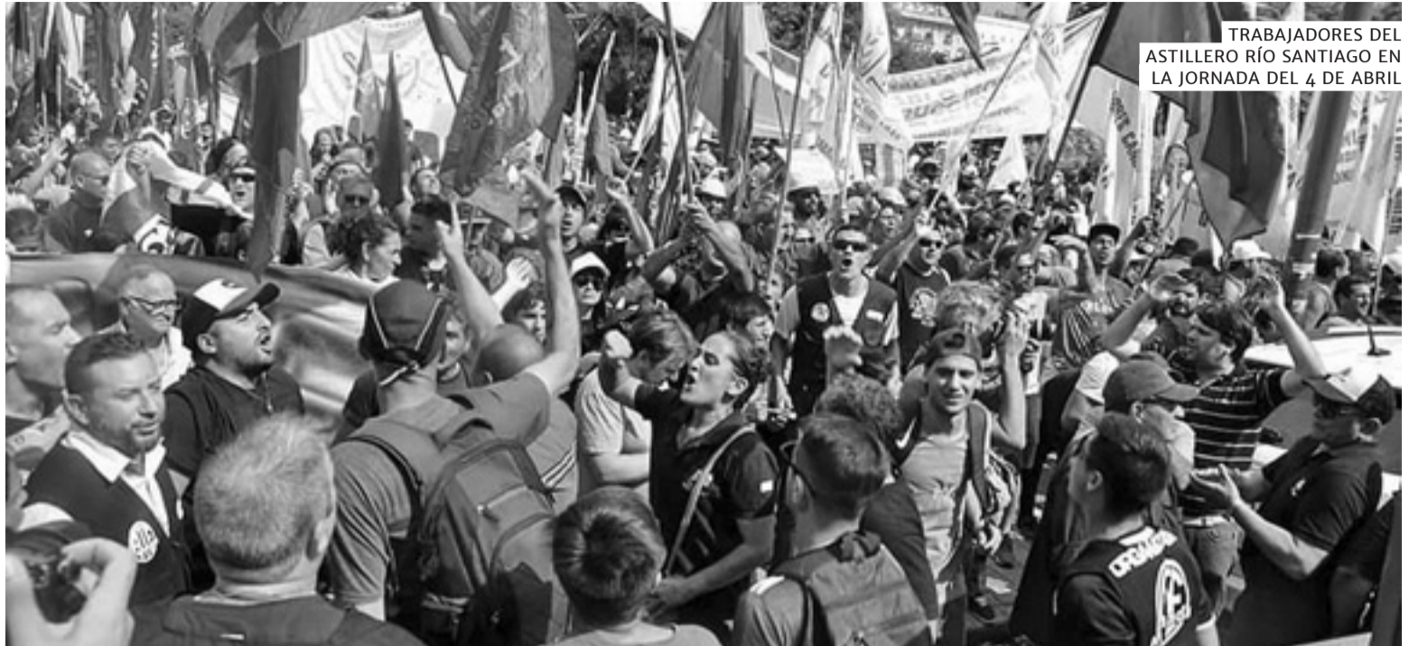
TRABAJADORES DEL ASTILLERO RÍO SANTIAGO EN LA JORNADA DEL 4 DE ABRIL

La política macrista hunde cada día a más argentinas y argentinos en la pobreza, la miseria y el desempleo. La jornada de lucha del 4 de abril y los acuerdos del frente En marcha muestran que se puede avanzar en las calles y las elecciones para enfrentar los planes del gobierno