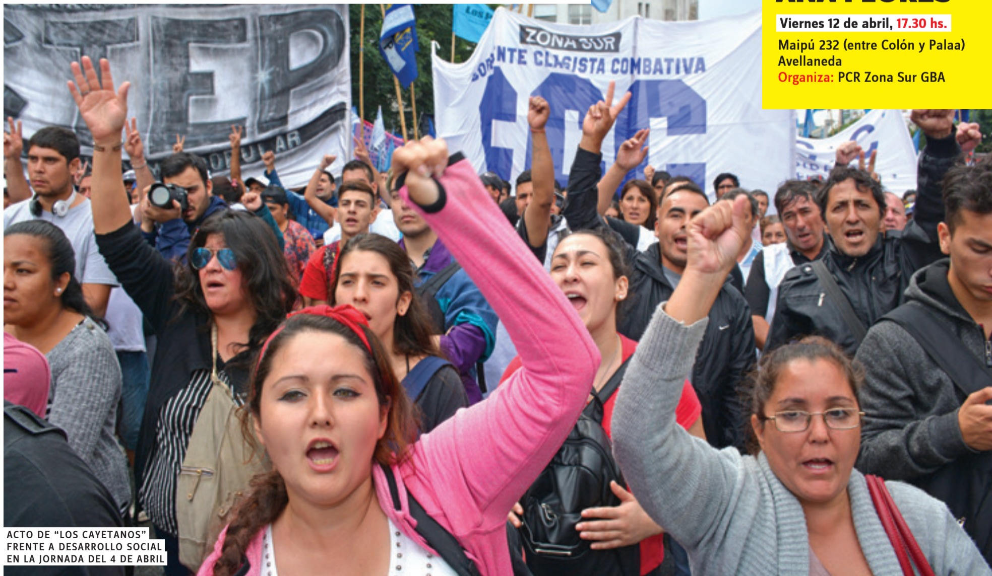
ACTO DE "LOS CAYETANOS" FRENTE A DESARROLLO SOCIAL EN LA JORNADA DEL 4 DE ABRIL

AVANZA EL MES DE LA PRENSA Por miles de nuevos lectores