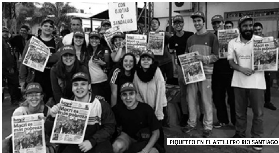
PIQUETE EN EL ASTILLERO RIO SANTIAGO

La Campaña arrancó bien: en su primera semana el hoy estuvo presente en la puerta de empresas, en las calles y en las plazas, en actividades de campaña electoral y en los lanzamientos de la campaña de prensa de Salta y del PTP en Jujuy. Los grupos empezaron a juntarse para