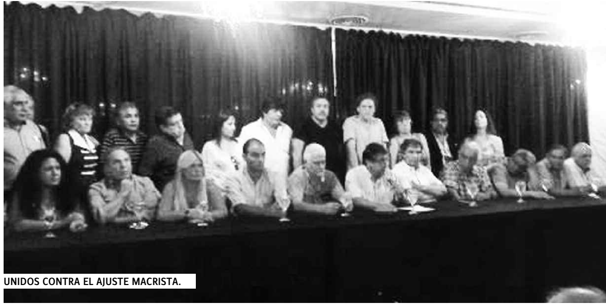
UNIDOS CONTRA EL AJUSTE MACRISTA.

El 22/2 realizaron una conferencia de prensa gremios estatales de la CTA Autónoma y de la CGT unidos en la Conagres (Coordinadora nacional de trabajadores estatales), para dar a conocer las medidas de fuerza que realizarán el 6 y 7 de marzo, así como el respaldo a la jornada del Día Internacional de la Mujer Trabajadora.