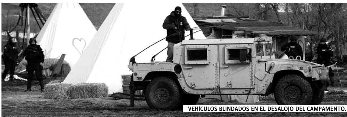
VEHÍCULOS BLINDADOS EN EL DESALOJO DEL CAMPAMENTO.

El jueves 24 de febrero un gran despliegue represivo de policías altamente militarizados desalojó violentamente el principal campamento