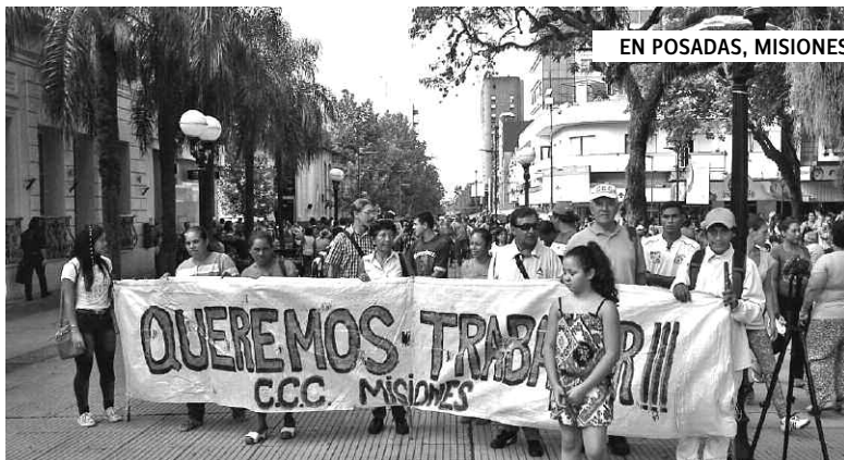
EN POSADAS, MISIONES