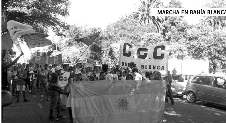
MARCHA EN BAHÍA BLANCA