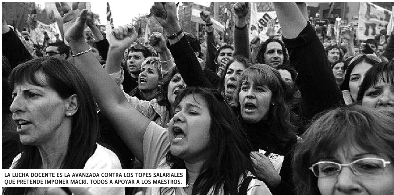
LA LUCHA DOCENTE ES LA AVANZADA CONTRA LOS TOPES SALARIALES QUE PRETENDE IMPONER MACRI. TODOS A APOYAR A LOS MAESTROS.