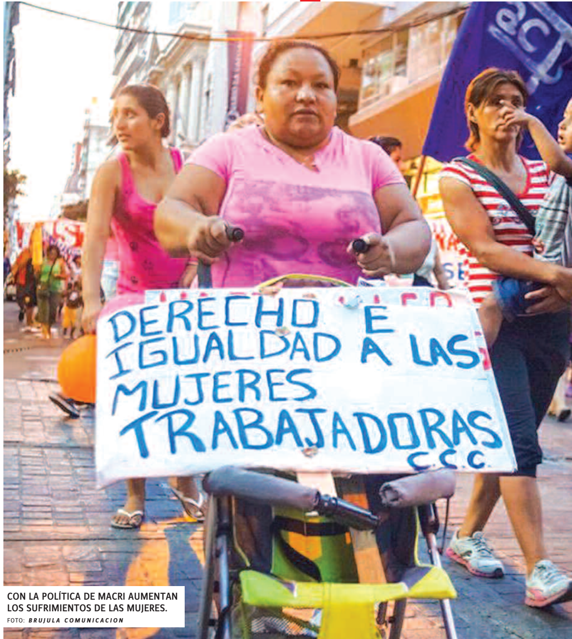
CON LA POLÍTICA DE MACRI AUMENTAN LOS SUFRIMIENTOS DE LAS MUJERES.

Nacionalmente, estamos coordinando para movilizar con CGT, CTA de los Trabajadores, CTA Autónoma, hacia la Plaza de Mayo. Hay reunión en CTA-A el miércoles 1 de marzo (al cierre de esta edición) para ampliar esta convocatoria. Trata-