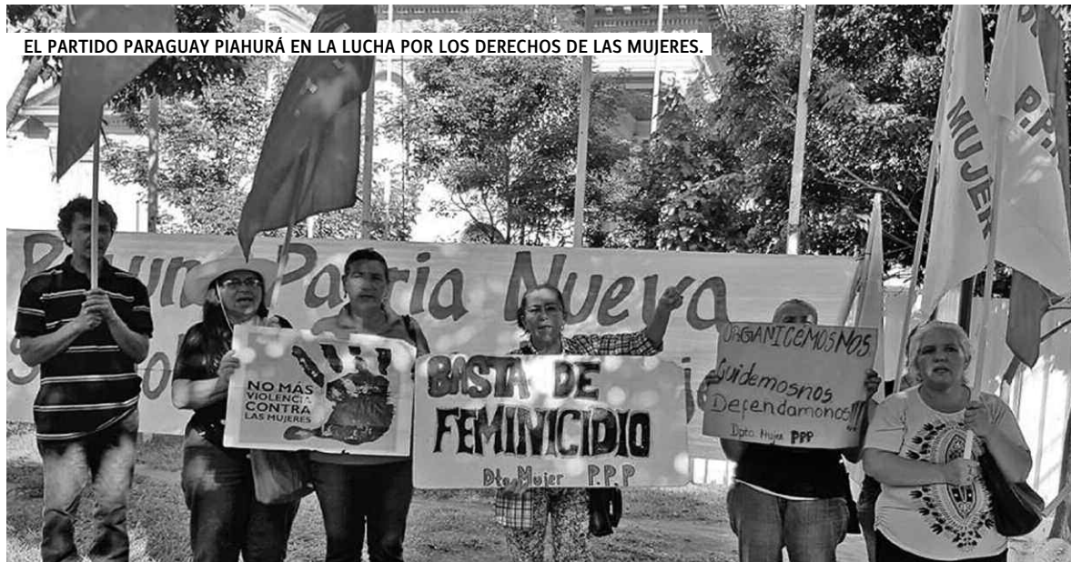
EL PARTIDO PARAGUAY PIAHURÁ EN LA LUCHA POR LOS DERECHOS DE LAS MUJERES.

No teníamos ni autoridad sobre nuestra producción ni cómo proceder en eso, sino solamente se hacía lo que permitía el marido,