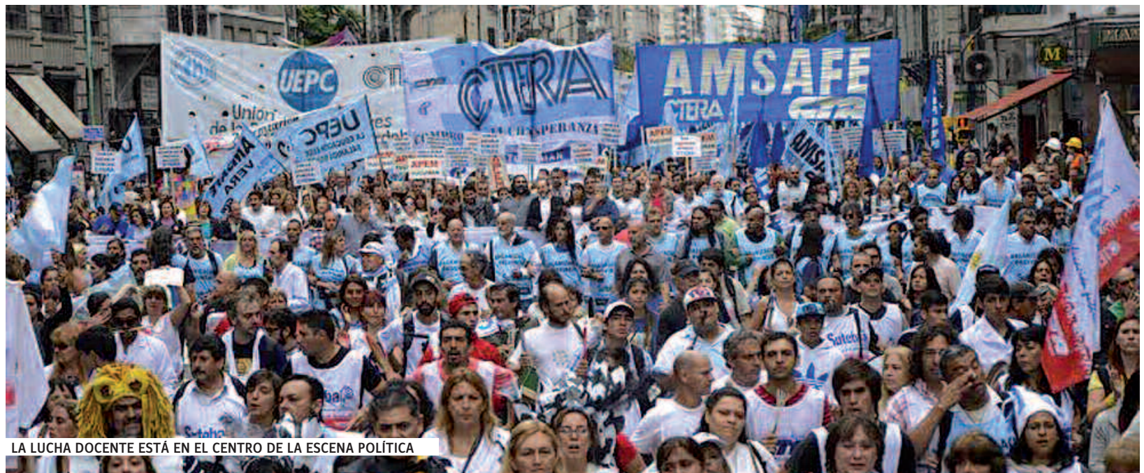
LA LUCHA DOCENTE ESTÁ EN EL CENTRO DE LA ESCENA POLÍTICA

Las propuestas realizadas a los docentes fueron 18% tanto a Buenos Aires, en 4 cuotas, como a CABA en 2, y a Entre Ríos. En Río Negro, Salta y Mendoza ofrecieron el 17% y en Jujuy el 10%. En San Luis ofertarán un aumento del 40%. La UDMP dirigi-