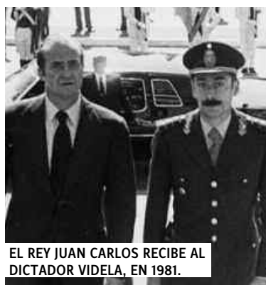
EL REY JUAN CARLOS RECIBE AL DICTADOR VIDELA, EN 1981.

distinción al entonces rey Juan Carlos, padre del actual jefe del estado español. ■