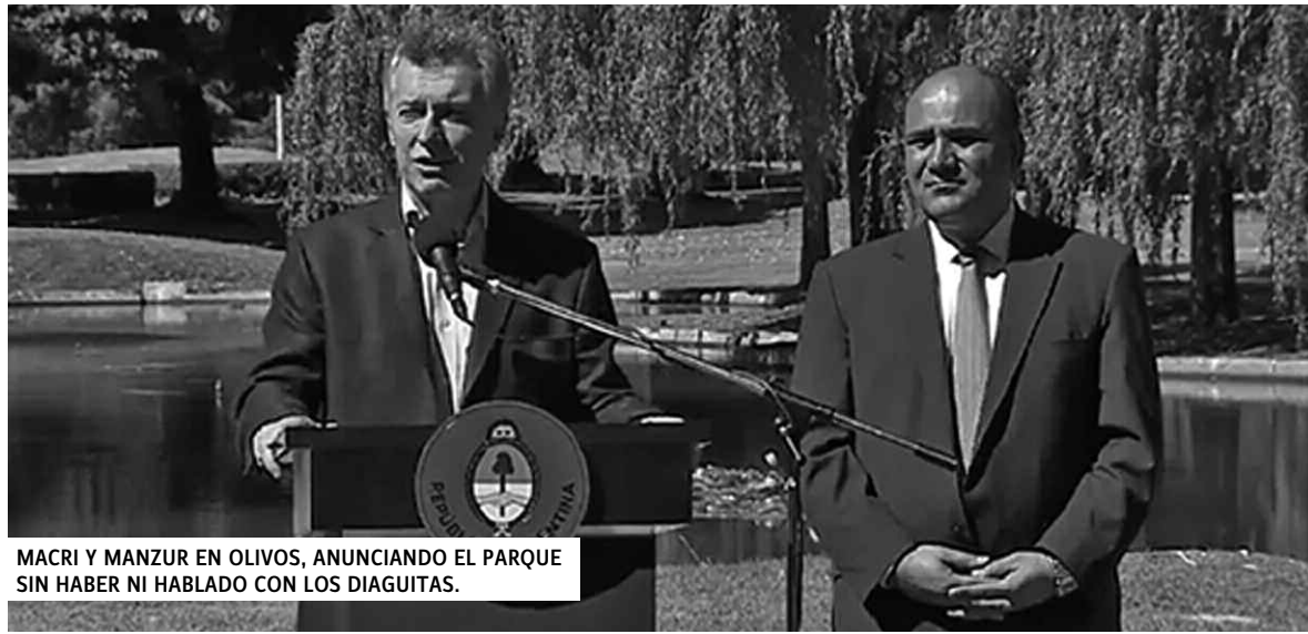
MACRI Y MANZUR EN OLIVOS, ANUNCIANDO EL PARQUE SIN HABER NI HABLADO CON LOS DIAGUITAS.

El 9 de Julio del Bicentenario, Macri trajo como "invitado de honor" a Juan Carlos, el corrupto y re-