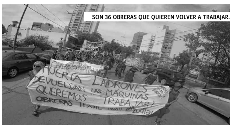
SON 36 OBRERAS QUE QUIEREN VOLVER A TRABAJAR.

La próxima boya es, por lo tanto, el acto del 17 de febrero, desde las 17 hs, en la Estación de Quilmes. Una cita de honor para las mujeres y el pueblo quilmeño, que permitirá poner el reclamo por la emergencia masivamente en las calles. ■