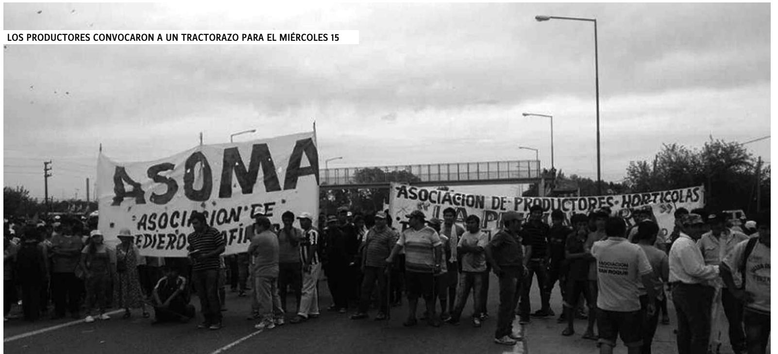
LOS PRODUCTORES CONVOCARON A UN TRACTORAZO PARA EL MIÉRCOLES 15

Algunos originarios de Bolivia piensan en irse. El que tiene algo allá puede ser, pero no está fácil empezar en Bolivia. Ya se han ido antes