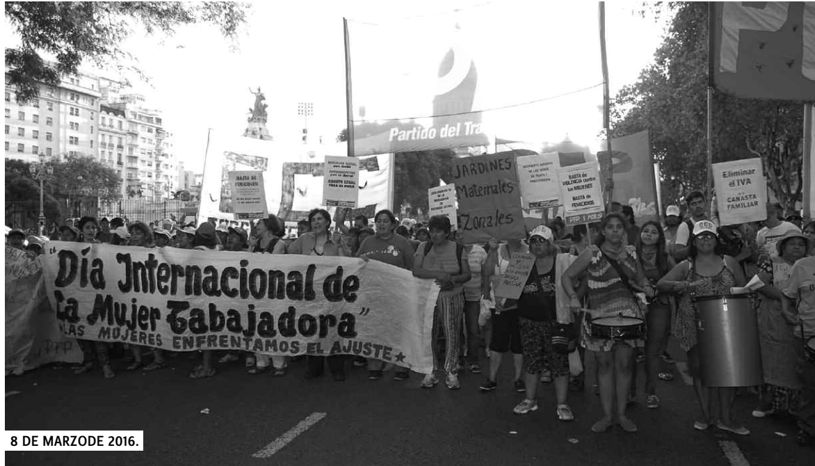
8 DE MARZO DE 2016.

En la Argentina, hace un poco más de un año que asumió el presidente Macri. No hubo una sola medida a favor del pueblo, y menos aún para las mujeres. Al contrario, sólo hubo más ajuste, más entrega y más