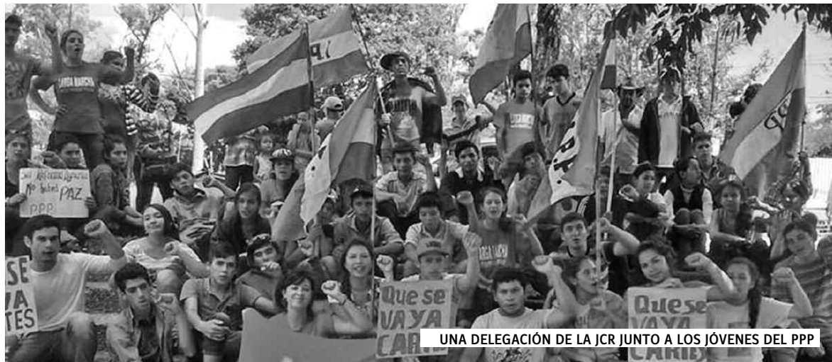
UNA DELEGACIÓN DE LA JCR JUNTO A LOS JÓVENES DEL PPP

profunda felicidad de nuestro pueblo", dice un párrafo de la convocatoria.