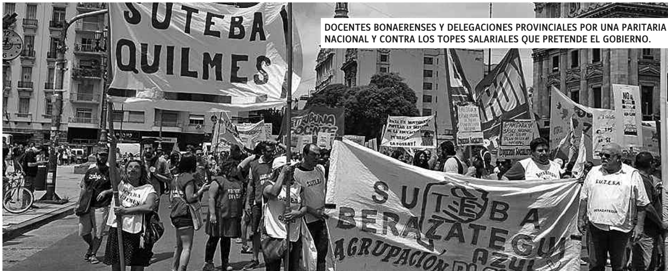
DOCENTES BONAERENSES Y DELEGACIONES PROVINCIALES POR UNA PARITARIA NACIONAL Y CONTRA LOS TOPES SALARIALES QUE PRETENDE EL GOBIERNO.