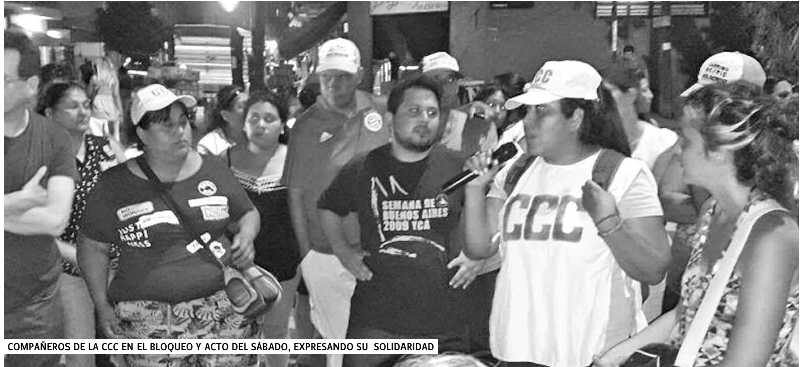
COMPAÑEROS DE LA CCC EN EL BLOQUEO Y ACTO DEL SÁBADO, EXPRESANDO SU SOLIDARIDAD

En la puerta de la toma de AGR conversamos con algunos trabajadores. Compañeros del PCR y de la CCC concurrieron a la planta para