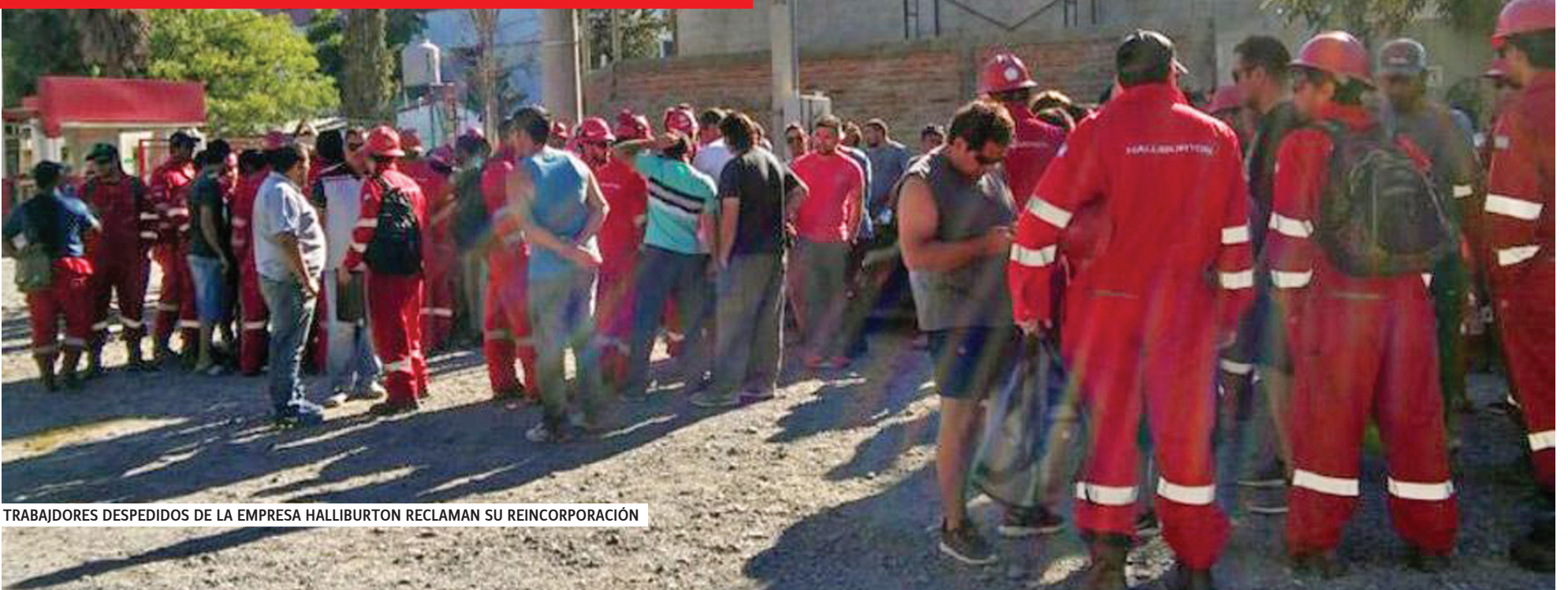
TRABAJADORES DESPEDIDOS DE LA EMPRESA HALLIBURTON RECLAMAN SU REINCORPORACIÓN

QUE LA PARITARIA NACIONAL DOCENTE DISCUTA EL AUMENTO SALARIAL