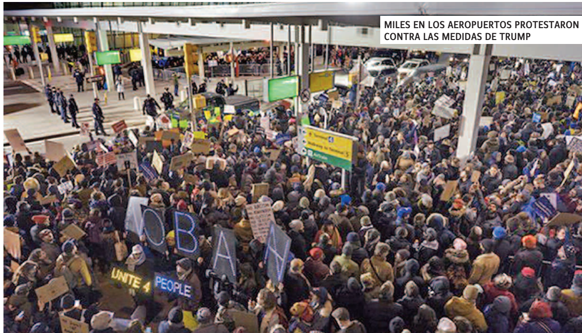
MILES EN LOS AEROPUERTOS PROTESTARON CONTRA LAS MEDIDAS DE TRUMP

El sitio web de la Casa Blanca expresa los nuevos vientos de la administración Trump, por ejemplo eliminando las secciones referidas al cambio ambiental, a los derechos civiles y de las personas LGBT, y bo-