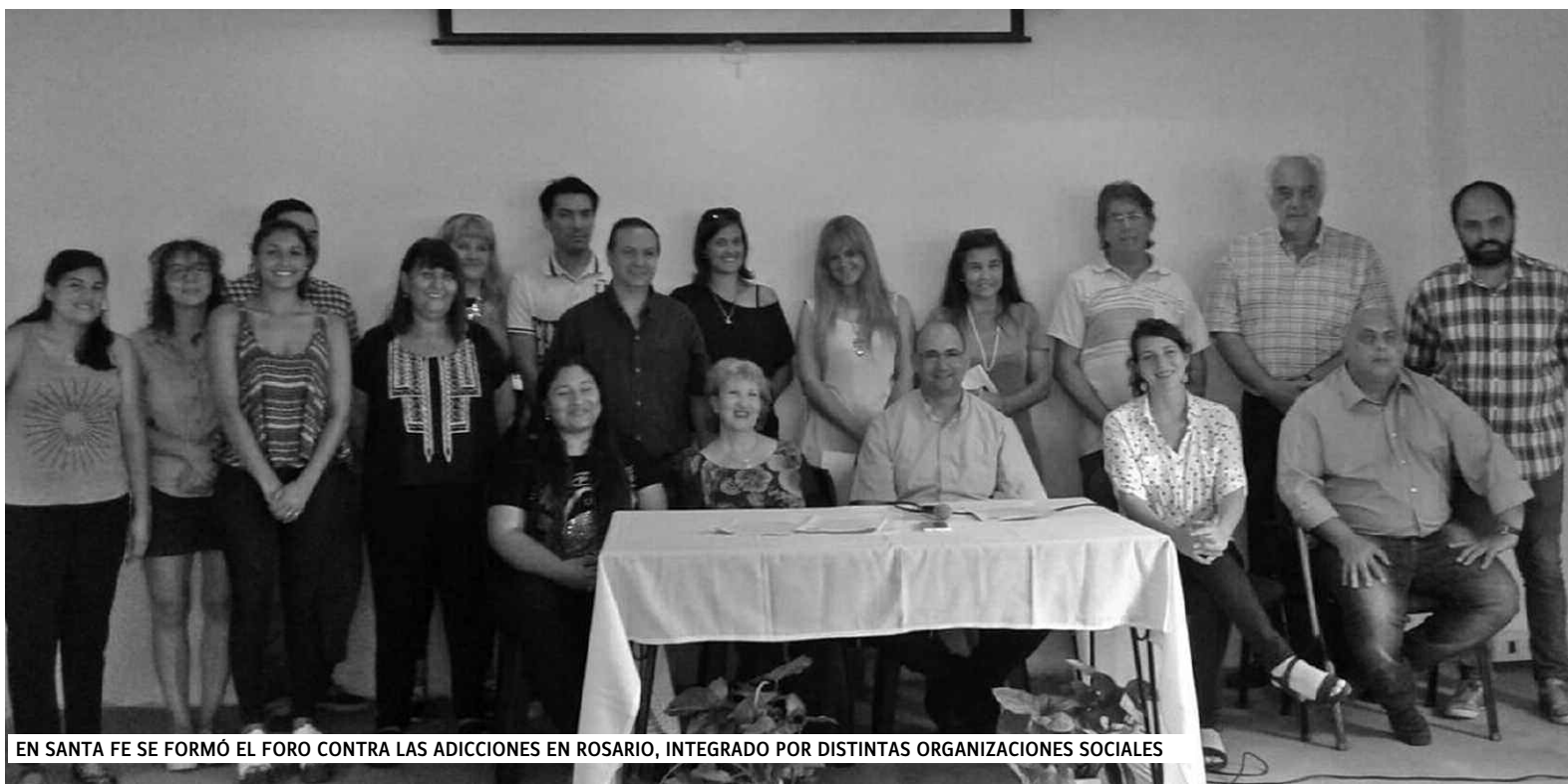
EN SANTA FE SE FORMÓ EL FORO CONTRA LAS ADICCIONES EN ROSARIO, INTEGRADO POR DISTINTAS ORGANIZACIONES SOCIALES