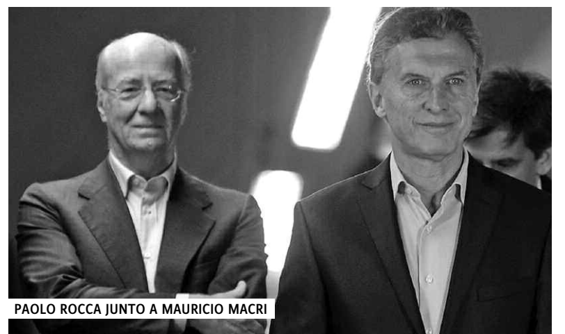
PAOLO ROCCA JUNTO A MAURICIO MACRI

Tecpetrol, según la estructura que informa su página web, se denomina Tecpetrol Internacional SA, constituida en las islas Vírgenes Británicas como Tecpetrol Internacional Inc. BVI, que figura inscripta en la IGJ como sociedad extranjera, opera a través de sus controladas Tecpetrol Internacional SL, sociedad española con domicilio registrado en Velásquez 17, Madrid, también inscripta en la IGJ como sociedad extranjera, y de Tecgas NV, sociedad constituida en Curaçao, en las An-