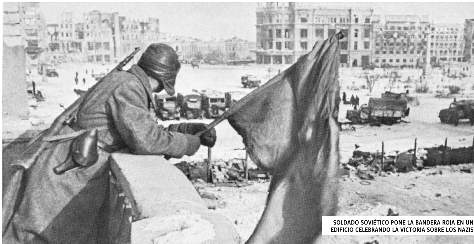
SOLDADO SOVIÉTICO PONE LA BANDERA ROJA EN UN EDIFICIO CELEBRANDO LA VICTORIA SOBRE LOS NAZIS

El 22 de junio de 1941, la Alemania nazi invadió la Unión Soviética con uno de los ejércitos más grandes de la historia universal. Hitler creía que iba a derrotar a los soviéticos en un lapso de tres meses, y casi todos los expertos militares y políticos del mundo estaban de acuerdo. La Alemania imperialista tenía las FFAA más modernas del mundo. Su fuerza de invasión constaba de tres millones de soldados, 3300 tanques, 7.000 cañones de grueso calibre y 2000 aviones. Sus FFAA acababan de conquistar Che-