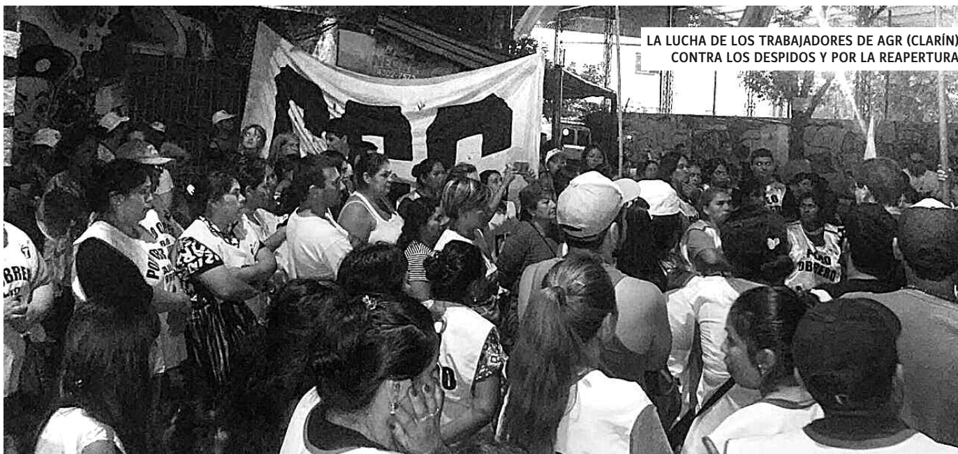
LA LUCHA DE LOS TRABAJADORES DE AGR (CLARÍN) CONTRA LOS DESPIDOS Y POR LA REAPERTURA.

ra la Argentina y el mundo que viene, profundizando el saqueo y la superexplotación, de la mano del gobierno de Macri. También lo hacen los grandes terratenientes, con su plan de sojizar el país, devorando, como buitres, las tierras de los pequeños y medianos productores arruinados y los originarios.