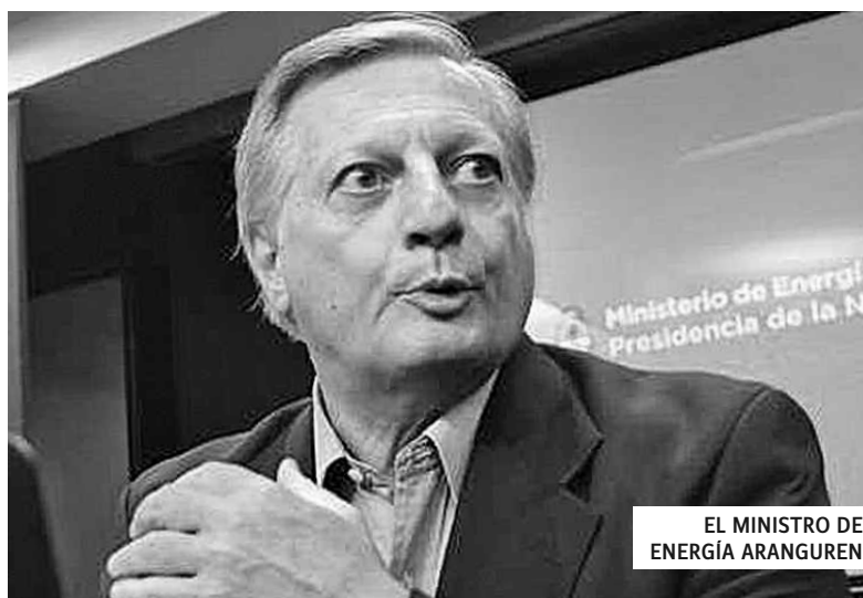
EL MINISTRO DE ENERGÍA ARANGUREN

El gobierno acaba de anunciar un nuevo tarifazo a la electricidad. Para el área metropolitana los aumentos van del 60% al 148%, en dos etapas (enero y febrero). A lo que suma otro aumento del 19% en noviembre (después de las elecciones). A este aumento hay que agregar, lo que no dice el ministro, el aumento proporcional de los impuestos que se cargan en las facturas. ¡Y el techo de aumentos a los salarios en paritarias es el 17%! El argumento de Macri es bajar los subsidios. ¿De dónde salen los subsidios? De los impuestos que paga el pueblo. ¿Cuánto es el costo para producir un kilowatt? El gobierno no lo investiga, y las empresas