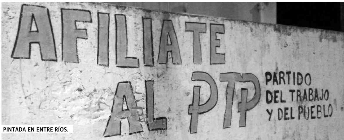
PINTADA EN ENTRE RÍOS.

El trabajo por conseguir la personería jurídica del PTP en Entre Ríos se sigue dando, casa por casa.