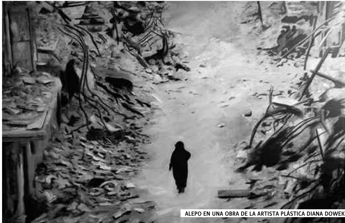
ALEPO EN UNA OBRA DE LA ARTISTA PLÁSTICA DIANA DOWEK

En Rimelan, Rojava, en el norte de Siria controlado por las guerrillas kurdas, se llevó a cabo entre el 27 y el 29 de diciembre una Asamblea Constituyente del Sistema Democrático Federal de Siria, con la participación de treinta partidos políticos y organizaciones civiles. Allí se destacó la importancia del alto el fuego y reclamaron "que todos los elementos claves deben sentarse alrededor de una mesa conjunta para la resolución de la crisis del país, con el fin de que no se repitan los intentos anteriores que fallaron". La Asamblea, reflejando la expansión de las fuerzas que la componen en el control del territorio, resolvió cambiar la denominación de "Rojava-Norte de Siria" por el de "Norte de Siria", para referirse al marco geográfico que abarca. Tras reiterar su apoyo a las Unidades de Defensa Popular (YPG/YPJ), la Asamblea repudió los ataques del Estado turco a varias poblaciones del norte sirio y concluyó declarando que "la Federación de Siria del Norte es parte de Siria".