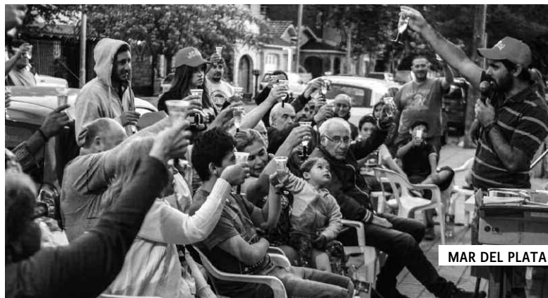
MAR DEL PLATA