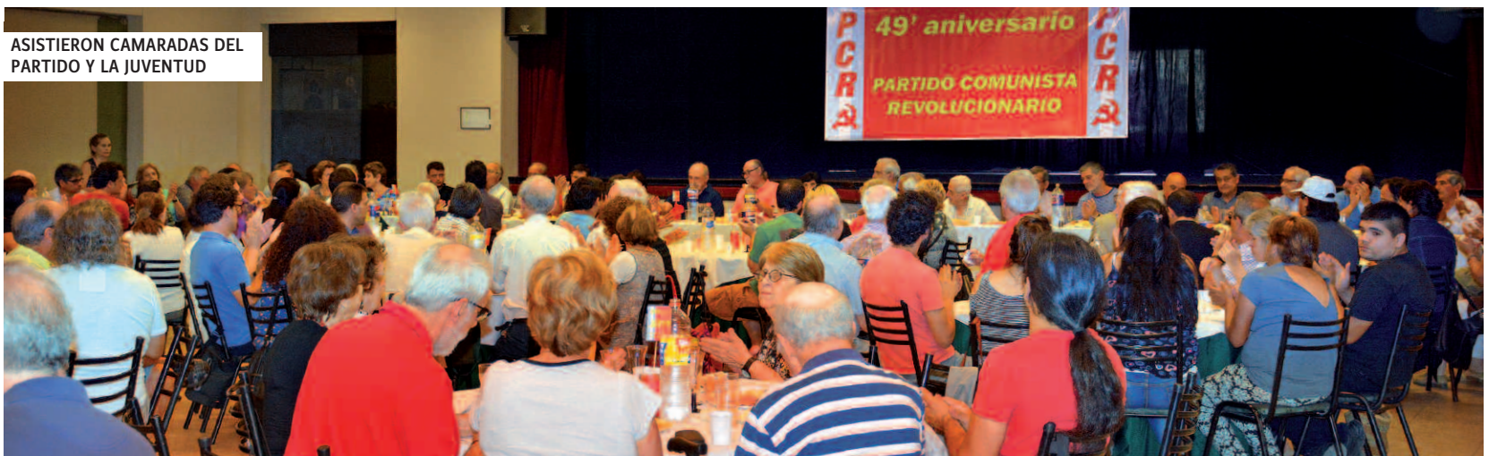
ASISTIERON CAMARADAS DEL PARTIDO Y LA JUVENTUD

El viernes 6 de enero, el Comité Central del PCR organizó un brindis central celebrando el 49 aniversario de su aparición pública, en 1968.