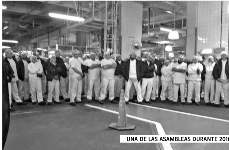
UNA DE LAS ASAMBLEAS DURANTE 2016

Terminamos un año con despidos, suspensiones y cierres de fábricas y eso es gente en la calle. La expectativa de este gobierno es que el trabajador tiene que estar a látigo. Tenemos que estar preparados y hacer hincapié en el avance de las automatizaciones; hoy las empresas planifican un sistema donde en