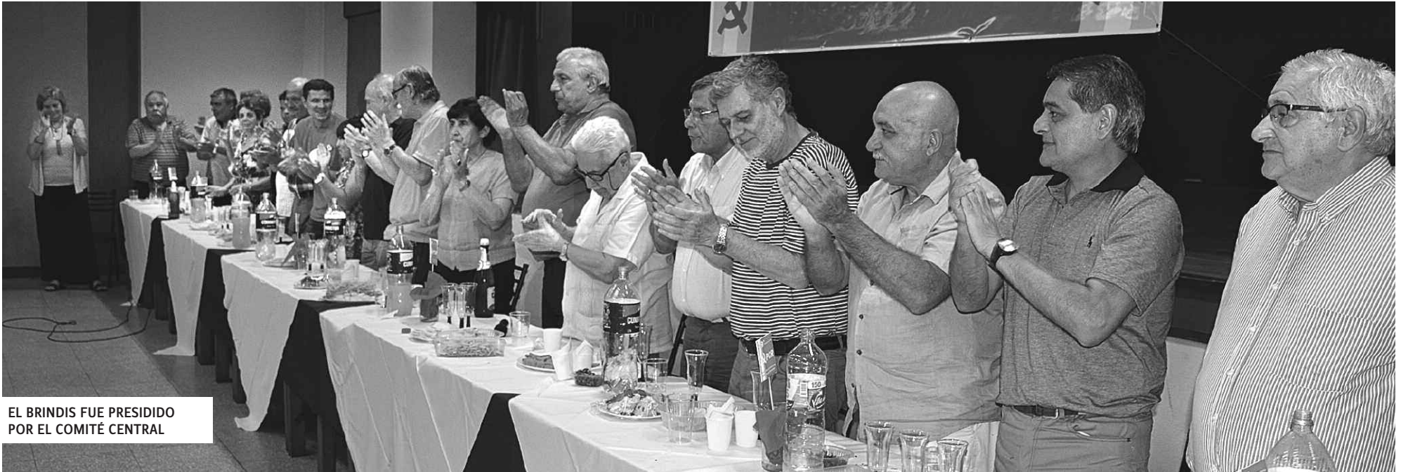
EL BRINDIS FUE PRESIDIDO POR EL COMITÉ CENTRAL