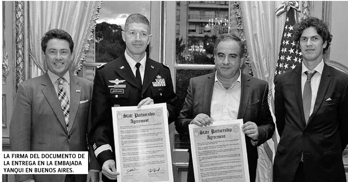
LA FIRMA DEL DOCUMENTO DE LA ENTREGA EN LA EMBAJADA YANQUI EN BUENOS AIRES.

Más tarde fue trascendiendo que el acuerdo abarca mucho más: programas de aviación, controles en fronteras, medicina militar, educación a distancia. Pero eso no es todo... El Programa de Colaboración Estatal está en manos del Departamento de Defensa de EEUU, es decir el Pentágono y agrupa a sus