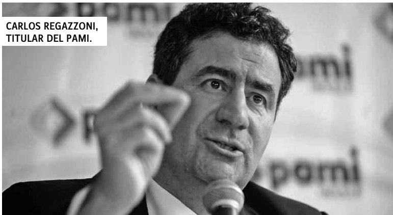
CARLOS REGAZZONI, TITULAR DEL PAMI.

Según ha planteado el titular de la eternamente intervenida obra social de los jubilados y pensionados, Carlos Regazzoni, el PAMI dejará de entregar medicamentos gratis a quienes cuenten con una prepaga, posean un auto de menos de 10 años o más de un inmueble, y quienes cobren más de 1,5 haberes previsionales mínimos. "No podemos dar un beneficio social a una persona que se va a veranear a Punta del Este", dijo.