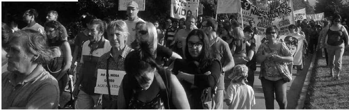
MASIVA MOVILIZACIÓN EN EL BOLSÓN, 7 DE ENERO.