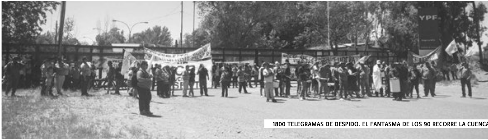
1800 TELEGRAMAS DE DESPIDO. EL FANTASMA DE LOS 90 RECORRE LA CUENCA