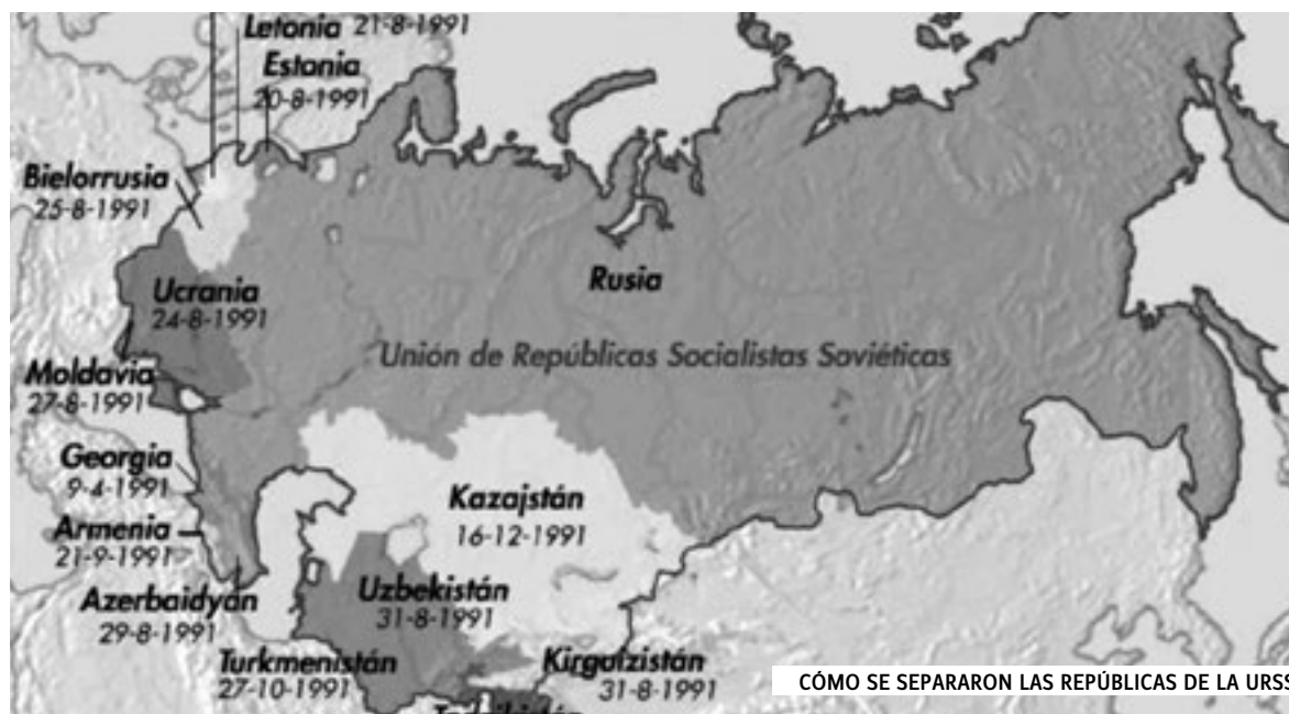
CÓMO SE SEPARARON LAS REPÚBLICAS DE LA URSS

“Pero ¿ha dejado por ello de existir el imperialismo ruso? Los hechos se van encargando de evidenciar que la clase dominante apela a otras formas para conservar el dominio ruso sobre las demás repúblicas que declaran su independencia e incluso sobre aquéllas que se separan. Se ve obligada a realizar concesiones pero conserva su absoluta superioridad militar y pretende perpetuar la dependencia económica de las repúblicas no rusas.