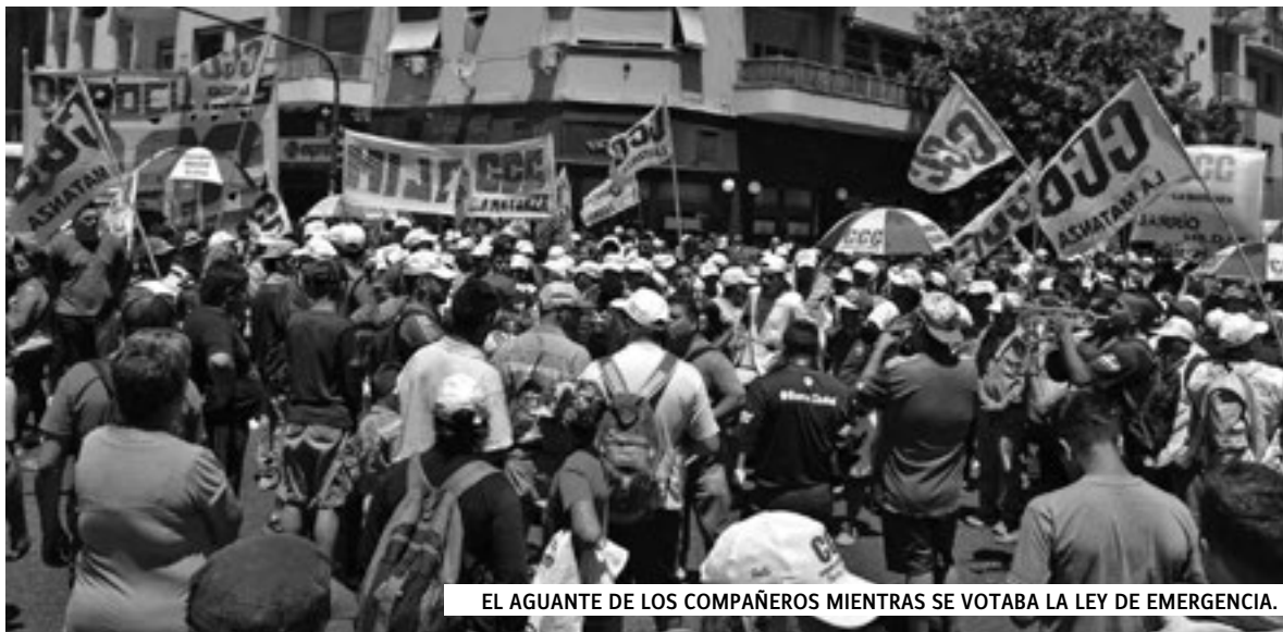
EL AGUANTE DE LOS COMPAÑEROS MIENTRAS SE VOTABA LA LEY DE EMERGENCIA.

Con el Congreso rodeado por miles de compañeras y compañeros, el Senado aprobó el miércoles 14, por unanimidad (49 votos a cero) la Ley de Emergencia Social que ya tenía media sanción de Diputados. Un gran triunfo de la lucha popular.