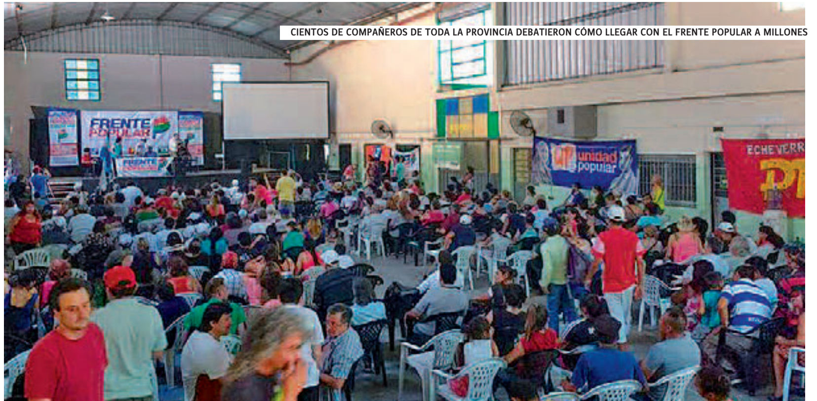
CIENTOS DE COMPAÑEROS DE TODA LA PROVINCIA DEBATIERON CÓMO LLEGAR CON EL FRENTE POPULAR A MILLONES

Pasado el mediodía, después de un rico debate, se reunió el plenario y se dio lectura a las conclusiones de cada comisión. En ellas se enfatizó la necesidad de poner todos los esfuerzos