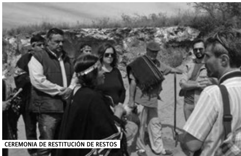
CEREMONIA DE RESTITUCIÓN DE RESTOS