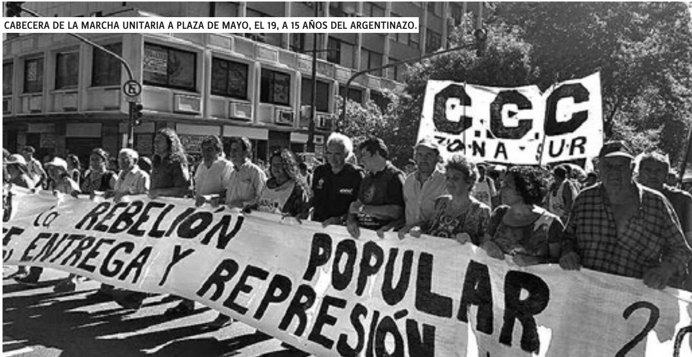
CABECERA DE LA MARCHA UNITARIA A PLAZA DE MAYO, EL 19, A 15 AÑOS DEL ARGENTINAZO.