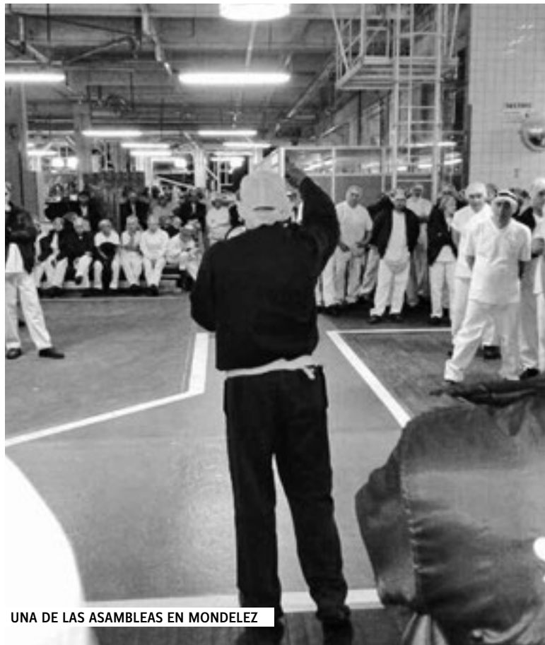
UNA DE LAS ASAMBLEAS EN MONDELEZ