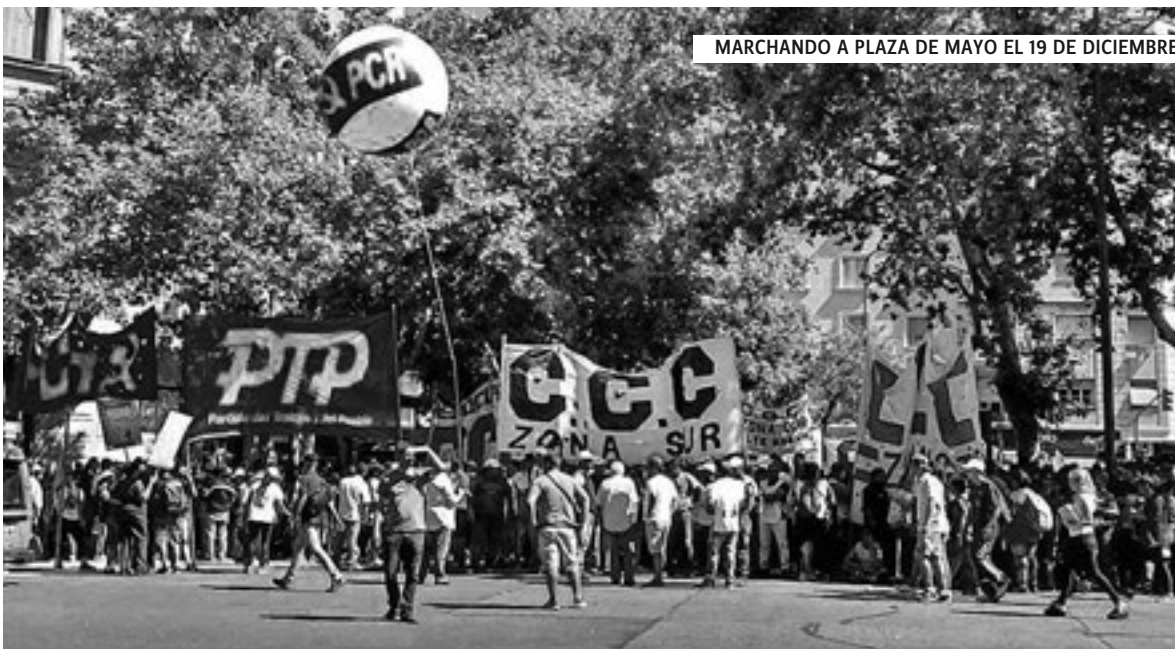
MARCHANDO A PLAZA DE MAYO EL 19 DE DICIEMBRE

Al cierre de esta edición se realizaban actividades por el aniversario del argentinazo, recordando la gesta histórica en el pueblo barrió a un gobierno hambreador y entreguista.